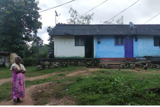
மொராராகலயில் தோட்டத்தில் தங்குமிடங்கள்.

சுற்றாடல் சேதம் போன்ற விடயங்களை நான் காணவில்லை. சிராம்பியடியில் அதிக தென்னந் தோட்டங்கள் இருக்கின்ற காரணத்தினால் காடழிப்புப் போன்றவை நடப்பதற்கான வழி இல்லை. ஆனால் சில பிரதேசங்களில் யானைகளின் பிரச்சினை இருக்கின்றது. இதனால் வறண்ட காலங்களில் பயிர்ச் சேதங்கள் அதிகரித்துள்ளன.