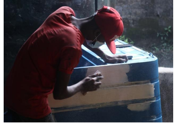
பயணக் கட்டுப்பாடு தளர்த்தப்பட்ட பின்னர் யாழ்ப்பாணம் நல்லூரில் கராஜில் உள்ள தொழிலாளர் அவரின் வேலையை மீண்டும் ஆரம்பித்துள்ளார்

எமக்கு அவை உரிய முறையில் கிடைத்தன. அதிகமான வெளியாட்கள் இருந்தனர். எம்மைப் பற்றிய மதிப்பு வைத்திருப்பவர்கள் அதிக உதவி செய்தனர்.