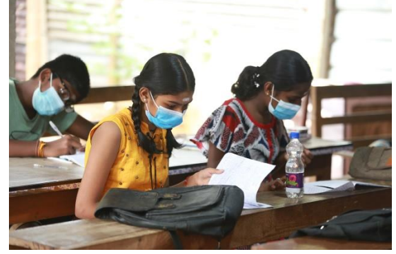
பயணக் கட்டுப்பாடு முடிவடைந்த பின்னர் மாணவர்கள் மாலை நேரத் தனியார் வகுப்பில் கல்வி கற்கின்றனர்.

பல்கலைக்கழகத்திற்கு இலவச இணைய வசதி வழங்கப்படுகின்றது. ஆனால் பாடசாலை மட்டத்தில் உள்ள ஆசிரியர்களுக்கும் மாணவர்களுக்கும் சொற்பமான வசதிகளும் தொழில்நுட்பம் பற்றிய வரையறுக்கப்பட்ட அறிவுமே காணப்படுகின்றன.