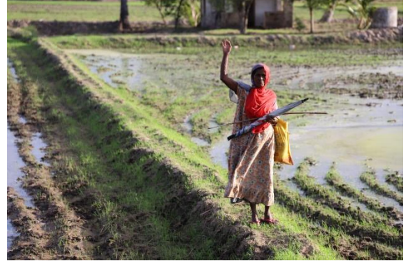
அநுராதபுரத்தில் பெண் விவசாயி ஒருவர் புகைப்படம் : அமீல உடகெதர 2021

நான் இபலகம பிரதேசத்தில் சமுதாயப் பணிகளில் ஈடுபட்டுள்ளேன். நான் பிரதேசத்தின் பிரதான பெண்கள் சங்கத்தின் செயலாளராக இருக்கின்றேன். எனது மகள் கடந்த வருடம் பல்கலைக்கழகத்திற்குத் தெரிவானார். அவரின் தவணை ஆரம்பித்துள்ளது.