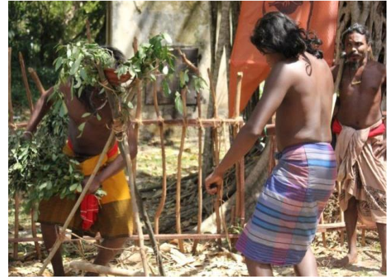
தம்பானியில் உள்ள ஆதிவாசிகள் சமுதாயம்

தம்பானியில் வசிக்கும் ஆதிவாசிகள் சமுதாயத்தினைச் சேர்ந்த 54 வயதான ஆண் ஒருவருடனான நேர்காணல். இவர் அரசாங்கப் பாடசாலையில் ஆசிரியராகத் தம்பானியில் கடமையாற்றுவதுடன் எழுத்தாளராகவும் இருக்கின்றார். தம்பானியில் உள்ள ஆதிவாசிகள் சமூகத்தில் இருந்து பல்கலைக்கழகத்திற்குத் தெரிவான முதலாவது நபராகவும் இவர் இருக்கின்றார்.