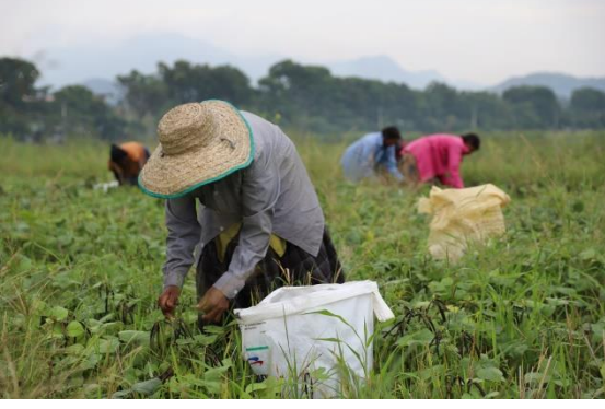
அந்நாட்புரத்தில் பெண் விவசாயிகள்.

எனது கணவர் ஒரு விவசாயி. நாம் குத்தகை விவசாய முறைமையின் கீழ் நெற்பயிர்ச் செய்கையில் ஈடுபட்டுள்ளோம். நோய்த் தொற்றுப் பற்றிய பயத்தின் காரணமாகவும் வைரஸ் பரவல் காரணமாகவும் மக்களால் ஒன்றுசேர்ந்து வேலை செய்ய முடியவில்லை. ஒவ்வொருவரும் மற்றவரை மிகுந்த சந்தேகத்துடன் பார்க்க ஆரம்பித்தனர். ஏனெனில் எம்மால் வைரசை மற்றவருக்குப் பரப்ப முடியும்.