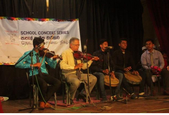
போர்த்துக்கேய பறங்கிய சமுதாயத்தினைச் சேர்ந்த உறுப்பினர்கள் கலாசார நிகழ்த்துகை ஒன்றின் போது.

கிழக்கு மாகாணத்தின் மூன்றாம் நிலைக் கல்வி நிறுவனம் ஒன்றில் முகாமைத்துவ உதவியாளராகப் பணியாற்றும் 38 வயதான போர்த்துக்கேயப் பறங்கிய சமுதாயத்தினைச் சேர்ந்த ஆண் ஒருவருடன் நேர்காணல் நடத்தப்பட்டது. கடந்த காலங்களில் இலங்கை போர்த்துக்கேய பறங்கிய சமுதாயத்தில் சிறுபான்மையினர் உரிமைகள் செயற்பாட்டியத்திலும் கலாசார ஒன்றுகூடல்களிலும் இவர் ஈடுபட்டுவந்தார்