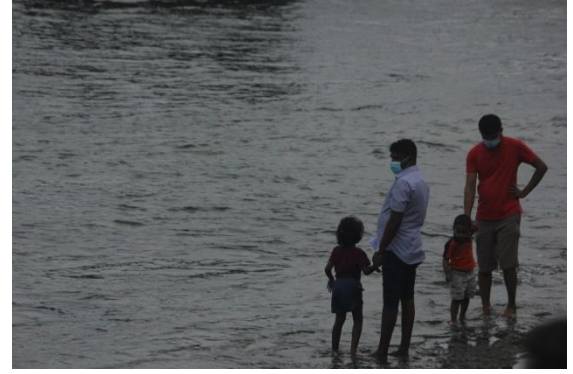
2020 இல் 1 வது முழுஅடைப்பு நிறைவடைந்து சில நாட்களின் பின்னர் காலிமுகத்திடல் கடற்கரை, சகுனா கமகே

அதிகாரிகளினால் எச்சரிக்கைகள் விடுக்கப்பட்டன. அதீத பிரச்சினை மிகுந்த இந்தச் சூழ்நிலையினூடு இலங்கை அதன் கொவிட் தடுப்புப் பொறிமுறைகளைத் தளர்த்தும் ஆர்வத்தினைக் கொண்டிருந்தது. நாட்டிற்குள் சுற்றுலாப் பயணிகளை பயோ பபிள்களினுள் அனுமதிப்பதற்காக இந்த ஆர்வம் காணப்பட்டது. மேலும் சிங்கள மற்றும் தமிழ்ப் புத்தாண்டு மற்றும் சிவனொளிபாத மலை யாத்திரைக் காலம் ஆகியவற்றினைக் கருத்தில் கொண்டு கட்டுப்பாடுகளைத் தளர்த்தும் ஆர்வம் காணப்பட்டது. இதன் விளைவாக, கொவிட் 19 தொற்றுக்களில் முன்னெப்பொழுதும் இல்லாத அதிகரிப்புக்கு நாடு முகங்கொடுக்க நேரிட்டதுடன் 2021 மே மாத நடுப்பகுதியில் இருந்து தொற்றுக்களில் 50 சதவிகிதத்திற்கும் அதிகமான வாராந்த அதிகரிப்புக் காணப்பட்டது.