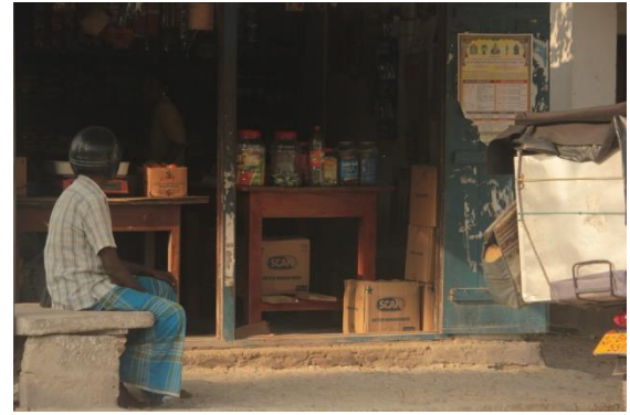
ஹம்பாந்தோட்டையின் கிராமத்தில் ஒரு சிறிய கடை

வரிசைகளில் எரிபொருள் நிரப்பக் காத்திருந்தனர். ஆனால் உண்மையான நிலை வேறாக இருந்தது. இதே நிலைதான் தற்போது காணப்படும் சீனி மற்றும் பால் மாப் பிரச்சினைகளிலும் நிலவுகின்றது. வித்தியாசமான அலைவரிசைகள் வித்தியாசமான விடயங்களை அவற்றின் அரசியல் ஆதாயத்திற்காகக் கூறி வருகின்றன. இவ்வாறான தவறான தகவல்களால் மக்கள் கஷ்டப்படுகின்றனர். ஊடகங்கள் பொறுப்புடன் நடந்து மக்களுக்குச் சரியான தகவல்களைச் சரியான நேரத்தில் வழங்கவேண்டும். இதுவே சமூக ஊடகங்களின் விடயத்திலும் நிலவவேண்டும். தற்போது அமுலில் உள்ள சட்டங்களும் ஒழுங்குவிதிகளும் அரசியல் விடயங்கள் பற்றிய கருத்துக்களை வெளிப்படுத்துவதற்கான சுதந்திரத்தினை மீறாமல் சமூக ஊடகங்களைக் கட்டுப்படுத்துவதற்காகத் தரமுயர்த்தப்படவேண்டும்.