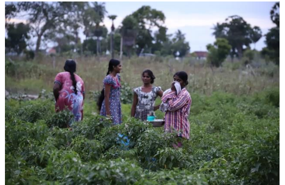
அநுராதபுரத்தில் பெண் விவசாயிகள்