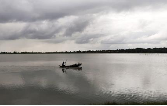
மட்டக்களப்பு உன்னிச்சையில் மீன்பிடிப் படகு

முறைசார் துறையில் இருப்பவர்களுக்கு மாதாந்தச் சம்பளம் கிடைப்பதால் அவர்கள் தங்களின் அத்தியாவசியத் தேவைகளைப் பூர்த்திசெய்கின்றனர். கடற்றொழில் மற்றும் விவசாயம் போன்ற முறைசாராத் துறைகளில் உள்ளவர்கள் முழுமுடக்கத்தின் காரணமாக அவர்களின் உற்பத்திகளை விற்பதற்குக் கஷ்டப்படுகின்றனர். அவர்கள் செய்துள்ள முதலீட்டுடன் நோக்குகையில் இது அவர்களுக்குப் பாரிய நட்டமாகும்.