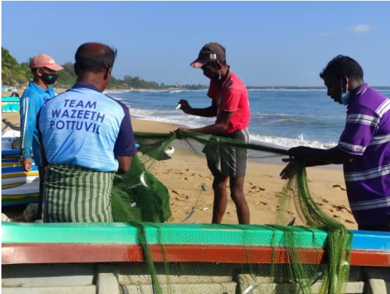
பொத்துவில்லில் மீனவ சமுதாயம்

சூழ்நிலை முற்றுமுழுவதும் எதிர்பாராத ஒன்று என்பதுடன் 2020 மார்ச் மாத முதலாவது முழுஅடைப்புடன் விடயங்கள் சடுதியாக மாறிவிட்டன. அதற்கு முன்னர் நான் கொழும்பில் வாடகைக்குத் தங்கியிருந்தே வேலை செய்துவந்தேன். அதற்கு நான் அதிகம்