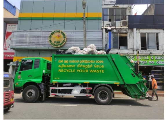
கொழும்பு மாநகர சபைத் துப்பரவுத் தொழிலாளர்கள் கொம்பனி வீதியில் குப்பைகளைச் சேகரிக்கின்றனர்

ஹோமகம் பிரதேசத்தில் நான் அவதானித்தது போல், கழிவுப் பொருட்களை மீள்சுழற்சி செய்யும் செயன்முறையில் சில பிரச்சினைகள் காணப்படுகின்றன. பெருந்தொற்றுச் சூழ்நிலையில் இதனை முகாமைத்துவம் செய்வதில் நடைமுறை ரீதியான பிரச்சினைகள் உள்ளன என்பது தெளிவானதாகும். ஒவ்வொருவரும் நகர சபையினைக் குறைகூறுகின்றனர் அல்லது இதில் சம்பந்தப்பட்டுள்ள மக்களை அவர்களே இதற்குப் பொறுப்பு என்ற ரீதியில் குறைகூறுகின்றனர். எவ்வாறாயினும், மக்களுக்கும் ஒரு பொறுப்பு இருக்கின்றது. அவர்கள் கழிவுகளை வீட்டில் உரிய முறையில் முகாமைத்துவம் செய்யும் பொறுப்பினைக் கொண்டுள்ளனர். மக்கள் அவர்களின் நடத்தையினையும் மனப்பாங்கினையும் மாற்றினால் இது மேலும் முன்னேற்றப்படக்கூடிய ஒன்றாகும். ஒவ்வொருவரும் வெளிநாடுகள் எவ்வளவு அழகாக உள்ளன எனப் பேசிக்கொள்கின்றனர். ஆனால் தமது நாட்டினை அழகாக வைத்திருப்பதற்கு யாருமே தனிப்பட்ட ரீதியில் பங்களிப்பு வழங்க முன்வருவதில்லை. அதிகமான மக்கள் குப்பைகளைப் புறநகர்ப் பகுதிகளில் தனியான இடங்களில் எறிவதற்கே முயற்சிக்கின்றனர். முழுமுடக்கத்தின் போது கூட இது பொதுவாக நடக்கின்றது. கழிவு முகாமைத்துவம் என வருகையில் இதனைச் சிறந்த முறையில் நிர்வகிப்பதற்கு நடவடிக்கை எடுக்கப்பட வேண்டும். காடழிப்பும் இதேபோன்றே நடக்கின்றது.