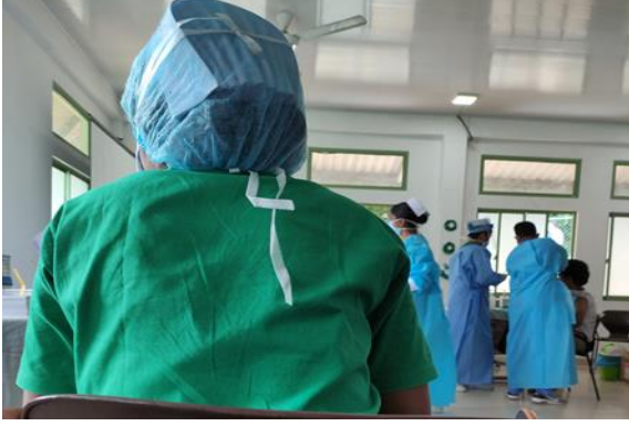
கண்டியில் தடுப்பூசியேற்றல் நிலையத்தில் சுகாதார அதிகாரிகளின் உதவி.

வீட்டில் தொற்றுத்தடைகாப்பில் இருக்கையிலேயே குறிப்பாக சுகாதாரத் துறையின் உதவி அதிகரித்துக் காணப்பட்டது. மேலும் தடுப்பூசியேற்றல் மூலமாகச் சிறந்த முறையில் உதவி வழங்கப்பட்டது. 30 வயதிற்கு மேற்பட்டவர்களில் பெரும்பான்மையானவர்களுக்கு முதலாவது தடுப்பூசி ஏற்றப்பட்டுள்ளது. ஏனையவர்கள் இரண்டாவது தடுப்பூசியினைப் பெற்றிருக்கலாம். குறிப்பிட்ட பிரச்சினை என எதுவும் இல்லை. அவர்கள் உதவி விழிப்புணர்வினையும் பிரதான சுகாதாரத் தேவைகளையும் நன்கு கையாண்டனர்.