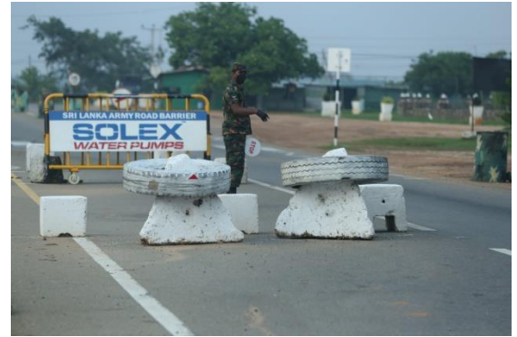
கொவிட் 19 பரவலைத் தடுப்பதற்கான நடவடிக்கையாக விதிக்கப்பட்டிருந்த பிராந்தியங்களுக்கிடையிலான பயணக் கட்டுப்பாட்டின்மூலம் யாழ்ப்பாணத்தில் ஆணையிறவில் சோதனைச் சாவடியில் இலங்கைப் பொலிசின் விசேட அதிரடிப்படையினர் முகக்கவசம் அணிந்தவாறு காவலில் நிற்கின்றனர்.

எனது கிராமத்தில் உள்ளக உதவிச் சேவைகள் சிறப்பாக அமைந்திருந்தன. ஆனால் தொற்றுத்தடைகாப்பில் இருந்த மக்களுக்கு 10,000 ரூபா அத்தியாவசியப் பொருட்களின் பங்கீட்டினை அவர்கள் வழங்கவில்லை. அது 14 நாட்கள் தொற்றுத்தடைகாப்பில் இருந்தவர்களுக்கு மட்டுமே வழங்கப்படும் எனக் கூறினார்கள். எமது பிரதேசத்தில் தொற்றுத்தடைகாப்புக் காலப்பகுதி 10 நாட்களுக்கு உட்பட்டதாக இருந்து. பிரதேசத்தில் சமுர்த்திப் பயனாளிகள் இருந்தனர். ஆனால் குறைந்த வருமானம் பெறும் குடும்பங்களுக்கே மானியம் வழங்கப்பட்டது. இப்போது அவர்கள் 2000 ரூபாவினை மானியமாக வழங்க ஆரம்பித்துள்ளனர். இச்செயன்முறைகளைப் பற்றி எனக்குப் பெரிதாக எதுவும் தெரியாது என்பதுடன் அவை நன்கு முகாமைத்துவம் செய்யப்படுகின்றனவா என்பதுவும் தெரியாது. இப்பிரதேசத்தில் செயன்முறைக்கு உதவுவதில் அரசியல் பிரதிநிதிகள் சம்பந்தப்படவில்லை. ஆனால் அருகில் உள்ள கொத்மலை மற்றும் பூண்டிலோயா பிரதேசங்களில் அமைச்சர்களில் ஒருவர் உதவியதாக நான் கேள்விப்பட்டேன்.