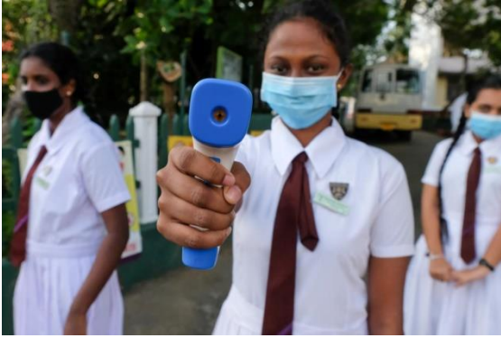
உடல் தொடுகையற்ற புறஊதா வெப்பமானியினை மாணவர்கள் பயன்படுத்துகின்றனர்.