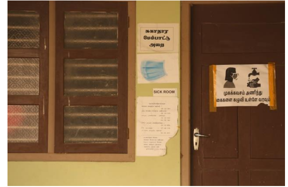
யாழ்ப்பாணத்திலுள்ள பாடசாலை ஒன்றில் சுகாதார அறிவுறுத்தல்களடங்கிய அறிவித்தல்கள்

பரிசோதனையினை மட்டுமே செய்தனர். எவ்வாறாயினும் வீட்டுக்கு வெளியே அவர்கள் எச்சரிக்கை அறிவித்தலை ஓட்டவில்லை. அவர்கள் ஏனைய குடும்ப உறுப்பினர்களைப் பரிசோதிக்கவுமில்லை. தொற்றுத்தடைகாப்பின் கீழ் இருப்பவர்களுக்கு அரசாங்கம் உலர் உணவுப் பொதிகளை வழங்கிவந்தது. ஆனால் எமது விடயத்தில் அது வழங்கப்படவில்லை. இந்தக் காலப்பகுதியில் அத்தியாவசியப் பொருட்களை வழங்கி அயலவர்கள் எமக்கு உதவினர். ஆனால் எமது கட்டாயத் தொற்றுத்தடைகாப்பின் பின்னர் எமது செலவுகளுக்காக அவர்கள் செலவிட்டவற்றினை நாம் மீண்டும் செலுத்த நேரிட்டது.