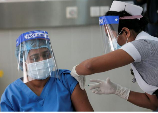
கொழும்பில் 2021 ஜனவரியில் சுகாதார அதிகாரி ஒருவருக்கு அஸ்ட்ரா ஜெனிகா கொவிட் - 19 தடுப்பூசி ஏற்றப்படுகின்றது

தடுப்பூசியேற்றும் செயன்முறை நன்கு நிர்வகிக்கப்பட்டது. கடந்த வாரம் எமக்கு முதலாவது ஊசி ஏற்றப்பட்டது. அடுத்த மாதம் எமக்கு இரண்டாவது தடுப்பூசி ஏற்றப்படும். கிராமத்தில் 60 வயதுக்கு மேற்பட்டவர்களுக்கு இரண்டு தடுப்பூசிகளும் ஏற்றப்பட்டுள்ளன. மக்கள் மத்தியில் முன்பு தடுப்பூசி ஏற்றுவது தொடர்பாகத் தயக்கம் காணப்பட்டது. ஆனால் பின்பு சில விழிப்புணர்வு நிகழ்ச்சித்திட்டங்கள் நடத்தப்பட்டன. நிர்வாகச் செயன்முறை நன்கு நடத்தப்பட்டது. அவர்கள் ஒரு நிலையத்தில் 3 கிராம சேவையாளர் பிரிவுகளுக்குத் தடுப்பூசியேற்றினார்கள். அதிகாரிகளால் நிலையத்தில் எவ்விதமான பரபரப்பும் இன்றிச் சமூக இடைவெளியினையும் சுகாதார வழிகாட்டல்களையும் பேணக்கூடியதாக இருந்தது.