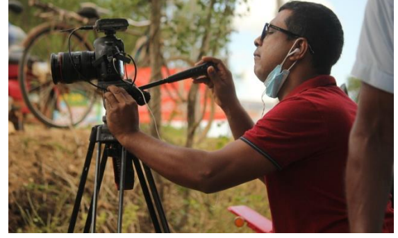
பெருந்தொற்றின் போது ஊடகம்

தொற்று ஏற்பட்டவர்கள் தொடர்பாகவும் ஏனையவர்களுக்கு தொற்று ஏற்படுத்தாதவர்கள் தொடர்பாகவும் தொற்று ஏற்படாதவர்கள் தொடர்பாகவும் அதிகமான வதந்திகள் உலாவந்தன.