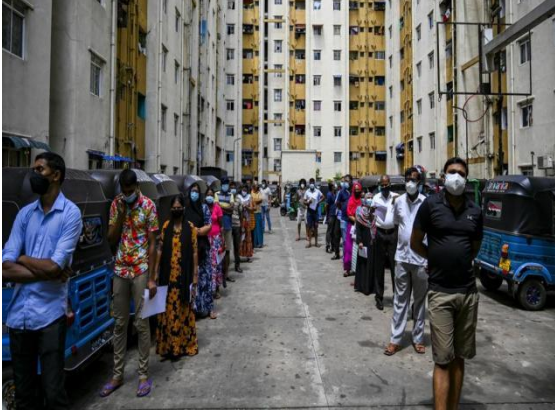
கொழும்பில் சஹஸ்ர வீடமைப்புத் திட்டத்தில் தடுப்பூசியேற்றுவதற்காக மக்கள் வரிசையில் காத்திருக்கின்றனர்.

நிகழ்ந்த இறப்புக்கள் பற்றி ஒவ்வொருவரும் சுகாதார அதிகாரிகளுக்கு அறிவித்தனர். மேலும் சிலருக்குத் தொற்றுக்கள் ஏற்பட்டதும் அதிகாரிகள் தொற்றாளர்களின் 1 ஆம் மற்றும் 2 ஆம் தொடர்புகளை அடையாளம் கண்டு தொற்றுத்தடைகாப்புச் செயன்முறையினை உரிய முறையில் மதிப்பிட்டனர். அவர்கள் பல பரிசோதனைகளையும் நடத்தினர். பொதுவாக, பெறுபேறுகளை அறிவிக்க ஐந்து நாட்கள் வரை எடுத்தது.