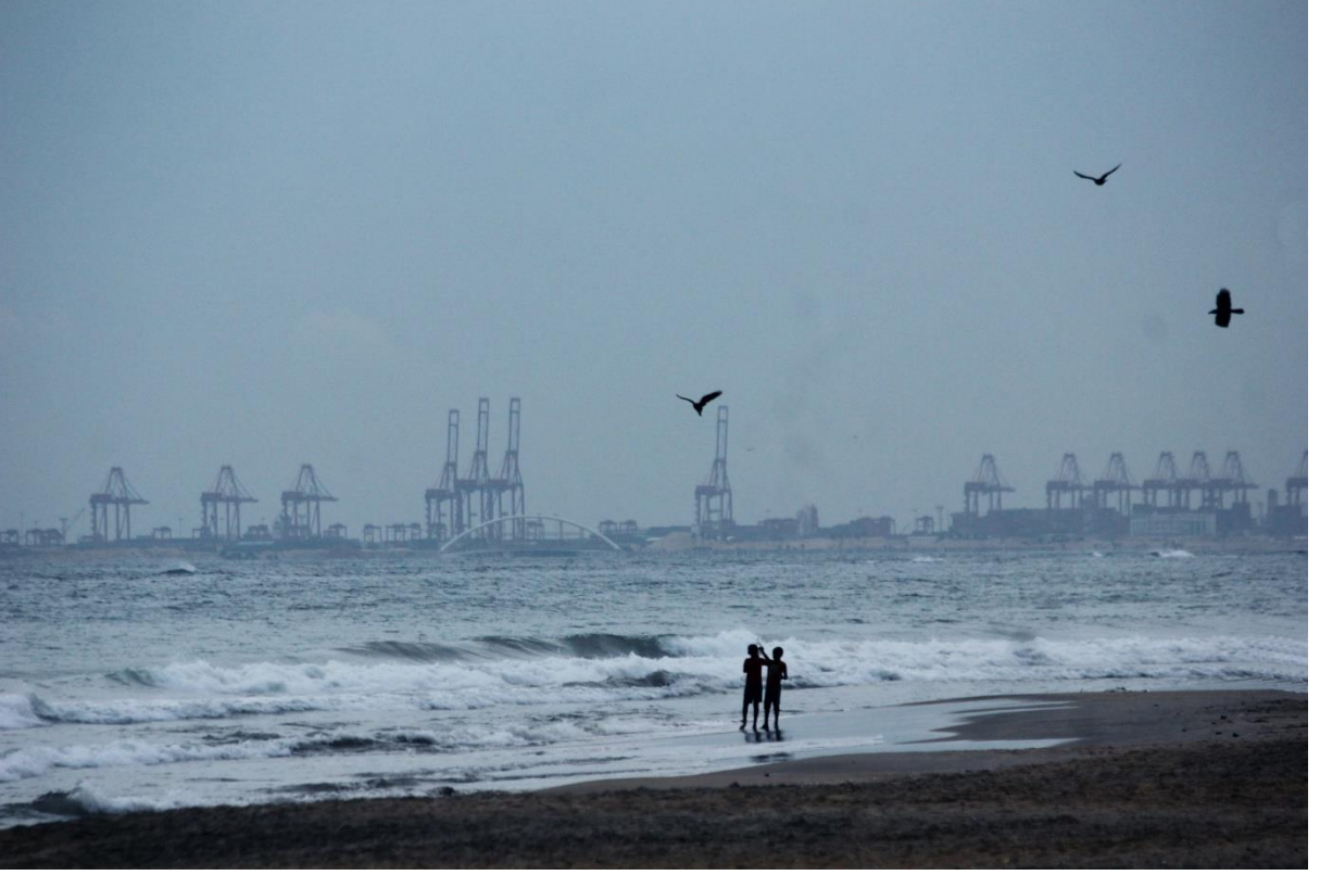
2020 இல் 1 வது முழுஅடைப்பின் பின்னர் தெஹிவளை கடற்கரையில் இருந்து துறைமுக நகரத்தின் காட்சி