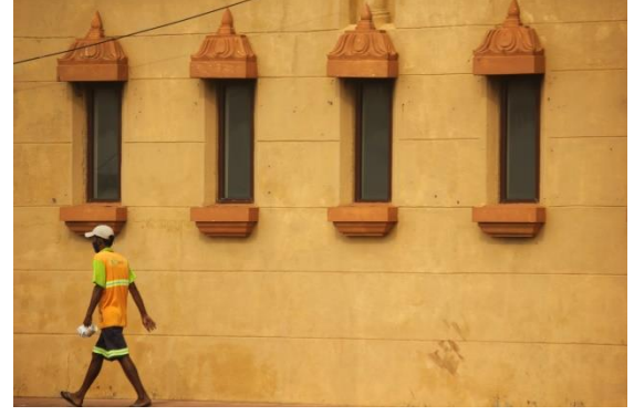
கொழும்பு வெள்ளவத்தயில் துப்பரவுத் தொழிலாளி

பொதுவாக, மக்களில் அதிகமானவர்கள் ஒழுங்குவிதிகளைப் பின்பற்றினார்கள். ஆனால் முழுஅடைப்பு மக்களின் வாழ்வாதாரங்களிலும் வருமானத்திலும் பெரும் தாக்கத்தினை ஏற்படுத்தியுள்ளது. எமது விளைச்சலை விற்பதிலும் அத்தியாவசியமான பொருட்களை வாங்குவதிலும் நாம் பெரும் பிரச்சினைகளுக்கு முகங்கொடுக்கின்றோம். எம்மைக் கவனிப்பதற்கு யாரும் இல்லை. மொத்தத்தில் கள மட்டத்தில் வறிய மக்களில் தாக்கம் செலுத்திய இந்தச் சூழ்நிலையினைக் கட்டுப்படுத்துவதற்கு உரிய திட்டமிடல் இல்லை என்கின்ற உணர்வு மேலோங்கியிருந்தது.