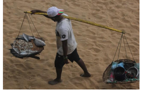
தெறுவளை கடற்கரையில் மீன் வியாபாரி

இந்த நேர்காணல்கள் கொவிட் - 19 பெருந்தொற்றில் அதிகரிப்பு ஏற்பட்ட மூன்றாம் அலையின் பின்னரும் பயணத் தடைகள் மற்றும் முழுமுடக்கத்தின் தொடர்ச்சியின் போதும் 2021, மே முதல் ஒக்டோபர் வரையான மாதங்களில் நடத்தப்பட்டன. நடமாட்டங்கள் கட்டுப்படுத்தப்பட்டிருந்ததாலும் நேரடியாக நேர்காணல்களை நடத்த முடியாதிருந்ததாலும் இந்த நேர்காணல்கள் தொலைபேசி அழைப்புக்கள் மூலம் நடத்தப்பட்டன.