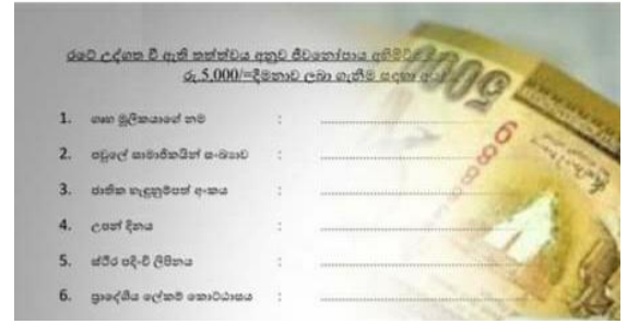
முழுமுடக்கத்தின் போது தமது வாழ்வாதாரங்களை இழந்த மக்களுக்கு அரசாங்க மானியமான 5000 ரூபாயினைப் பெறுவதற்கு நிரப்பவேண்டிய படிவம்.

துப்பரவுசெய்தல், வைத்தியசாலைகளைத் துப்பரவுசெய்தல் போன்ற ஏதாவது வேலைகளைச் செய்யுமாறு கோரினர். இந்தச் சந்தர்ப்பத்தில் இது ஒரு சிறந்த நடவடிக்கை அல்ல. ஏனெனில் மக்கள் ஒன்றுகூடுவதில் உள்ள ஆபத்துக் காரணமாக - இது முழுமுடக்கத்தின் நோக்கத்திற்கு எதிரானதாகும். மானிய உணவுப் பொருட்களை நிர்வகித்து விநியோகிப்பதில் வேறு பிரச்சினைகளும் காணப்பட்டன. சில மக்களுக்கு மானியப் பொருட்களுக்கான தகைமை இல்லாதிருந்தும் அல்லது அவர்களுக்கு அவ்வகையான உதவிக்கான தேவை இல்லாதிருந்தும் அவர்களுக்கு அவை வழங்கப்பட்டன. அவர்கள் சக்திவாய்ந்த மக்களுடன் தொடர்புபட்டவர்கள்.