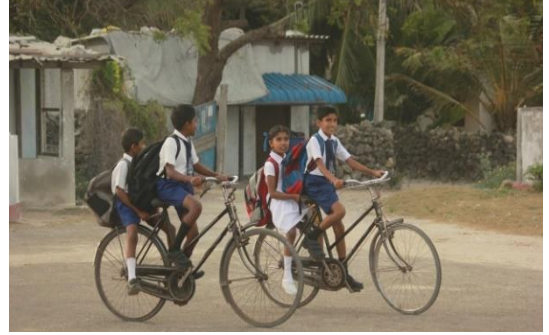
யாழ்ப்பாணத்தில் பிள்ளைகள் பாடசாலைக்குச் செல்கின்றனர்

கொவிட் தொற்றுக்காளான 65 வயதுக்கு மேற்பட்டவர்களைத் தனியார் வைத்தியசாலைகள் அனுமதிப்பதில்லை.