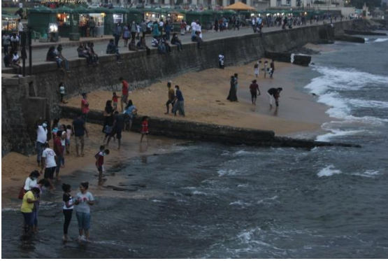
2020 இல் முதலாம் முழுஅடைப்பு நிறைவடைந்த சில நாட்களின் பின்னர் காலிமுகத்திடல், சகுனா கமகே

ஒக்டோபர் முதலாம் வாரத்தில், மினுவங்கொடியிலும் திவுலப்பிடயவிலும் ஆடை உற்பத்தித் தொழிற்சாலை ஊழியர்களின் கொத்தணியால் ஆரம்பித்த தொற்றின் இரண்டாம் அலையின் பரவலைக் கட்டுப்படுத்த அரசாங்கம் சில கடுமையான முறைகளை மீள விதித்தது.