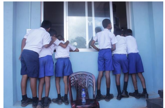
இடைவேளையின் போது பாடசாலை மாணவர்கள் கொழுப்பு, பன்னிப்பிடிப்பில் கூட்டு அவதானிப்பில் ஈடுபடுகையில் 2021

கல்வி முழுவதுமாக ஒன்லைன் முறைமைக்கு மாற்றப்பட்டமையினால் பல சிரமங்கள் ஏற்பட்டன. மக்களில் பெரும்பான்மையானவர்களிடம் தொழில்நுட்ப