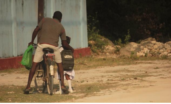
யாழ்ப்பாணம், நெடுந்திவில் ஆரம்ப பாடசாலையில் மகளை விடும் தந்தை

சிரமங்களை எதிர்நோக்குகின்றனர். ஒன்லைன் கல்வி முறை சகலருக்கும் செயந்திறனானது அல்ல. கல்வியினை ஒன்லைனில் தொடர்வதற்கு அவர்களிடம் வசதிகளோ அல்லது சரியான வகை உபகரணங்களோ அல்லது நிதி வளமோ இல்லை. இந்தப் பிரதேசத்தில் இணைய வலையமைப்புக்கான சமிக்ஞை மிகவும் பலவீனமாகக் காணப்படுகின்றது. தொலைபேசியில் கலந்துரையாடலை நடத்தும்போது நீங்களும் அச்சிரமங்களுக்கு முகங்கொடுத்திருப்பீர்கள் என நான் நினைக்கின்றேன். இப்போது கூட நான் சமிக்ஞை சிறந்ததாக இருக்கும் ஓரிடத்திற்கு வந்துள்ளேன். தொலைபேசி அழைப்பினை எடுப்பதற்கு நாங்கள் அனைவரும் இந்த இடத்திற்குத்தான் வருகின்றோம்.