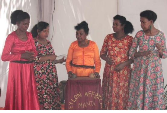
நாட்டார் இசையினை இசைக்கும் இலங்கை ஆபிரிக்க சமுதாய உறுப்பினர்கள்.

பெருந்தொற்றுப் பற்றிய உங்களின் அனுபவம் என்ன மற்றும் அது உங்களின் வாழ்க்கைப் பாங்குகளை எவ்வாறு மாற்றியுள்ளது?