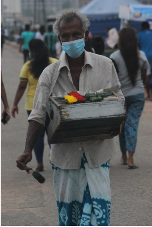
காலி முகத்திடலில் பீடா வியாபாரி.