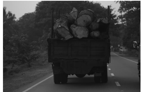
A9 வீதியில் கிளிநொச்சியில் வெட்டப்பட்ட களமரங்கள் ஊர்திகளில் எடுத்துச்செல்லப்படுகின்றன.

ஒரு மாதத்திற்கு முன்னர் எனது தந்தைக்குக் காய்ச்சல் ஏற்பட்டது. அவருக்குக் கொவிட் - 19 தொற்று ஏற்பட்டிருக்குமோ என்ற பயத்தில் நான் அவரை வைத்தியசாலைக்கு அழைத்துச் சென்று அண்டிஜென் பரிசோதனை செய்யுமாறு கேட்டேன். அவ்வாறாயின் அவரை வைத்தியசாலையில் அனுமதிக்கவேண்டும் எனக் கூறினார்கள். அவ்வாறு அனுமதிக்க விரும்பாவிடின் அவரைச் சுகாதார மருத்துவ அதிகாரியிடம் அழைத்துச் சென்று மருந்து எடுத்து வீடு செல்லவேண்டும் எனக் கூறினார்கள். வைத்தியசாலை நீண்ட காலமாகத் துப்பரவு செய்யப்படவில்லை. வாட்டுக்களும் கழிப்பறைகளும் மிகவும் அழுக்காக இருந்தன. நான் ஒரு கடிதத்தினை எழுதித் தந்தையை வீட்டுக்கு அழைத்து வந்தேன். ஏனெனில் வைத்தியசாலையின் சுகாதாரக் கேடு தொற்றினை இன்னும் மோசமாக்கலாம்.