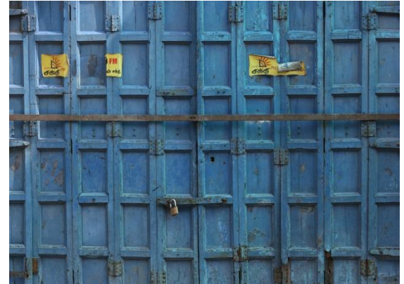
கொவிட் பரவல் காரணமாக யாழ்ப்பாண நகரத்தில் தனிமைப்படுத்தப்பட்ட பிரதேசத்தில் மூடப்பட்டுள்ள கடை

செயன்முறையினுள், பல பிரச்சினைகள் காணப்பட்டன. குறிப்பாக அரசியல் செல்வாக்கின் காரணமாகத் தகைமையுடைய மக்களும் மிகவும் தேவையுடைய மக்களும் இதில் இருந்து விலக்கிவைக்கப்பட்டனர். இது தொடர்பாகப் பல முறைப்பாடுகள் மேற்கொள்ளப்பட்டன. சமூக இடைவெளியினைப் பேணுவதற்கு வசதியாகப் பயனாளர்களைக் கிராம சேவை அதிகாரியின் அலுவலகத்திற்கு அழைத்து அல்லது வேறு சமுதாய இடங்களுக்கு அழைத்து இது விநியோகிக்கப்பட்டது.