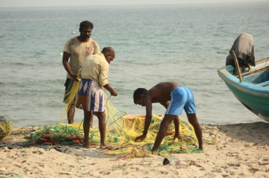
யாழ்ப்பாணம் காரைநகரில் மீனவ சமுதாயம்

வாழ்க்கை என்பது மிகவும் கடினமானதாக மாறியுள்ளது. அரசாங்கத்திடம் இருந்து எமக்குப் போதிய உதவி கிடைக்கவில்லை. நாம் கடன்கள் எடுத்துள்ளோம். அதன் வட்டி மிக உயர்வாக உள்ளது. அவற்றினை மீளச் செலுத்துவதற்கு நாங்கள் கஷ்டப்படுகின்றோம். எனது மகளின் கணவர் குத்தகைக்கு ஒரு வாகனத்தினை வாங்கியுள்ளார். அதற்கான கட்டணத்தினைச் செலுத்துவதற்கும் நாங்கள் கஷ்டப்படுகின்றோம். ஒரு சிறு வியாபாரத்தினை நடத்துவதற்கே நாங்கள் அதனை வாங்கினோம். ஆனால் குத்தகை செலுத்துவது கடினமானதாக மாறியதால் நாங்கள் அதனை வாடகைக்காக இராணுவத்திற்கு வழங்கியுள்ளோம். எனது மருமகன் நிர்மாண வேலைகள் செய்துவந்தார். ஆனால் பெருந்தொற்றால் அதனைத் தொடர முடியவில்லை. எவ்வாறாயினும் எமது வீட்டுத் தோட்டத்தின் காரணமாக எமது உணவுப் பாதுகாப்பில் எவ்வித பிரச்சினைக்கும் நாம் முகங்கொடுக்கவில்லை.