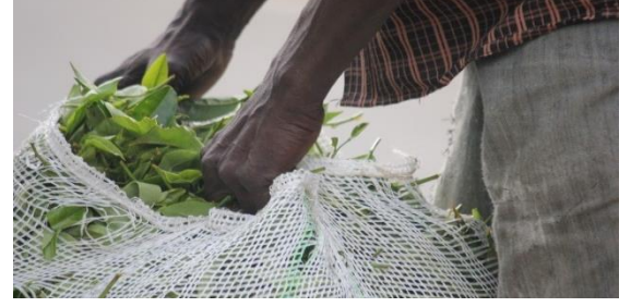
ஹற்புத்தளையில் உள்ள தோட்டத்தில் பறித்த தேயிலைக் கொழுந்துடன் ஒரு தொழிலாளி 2017

மக்களில் அதிகமானவர்கள் பெருந்தோட்டத் துறையில் வேலை செய்கின்றனர். அவர்கள் தேயிலைத் தோட்டத்தின் சகல அம்சங்களிலும் சம்பந்தப்பட்டுள்ளனர் - கொழுந்து பறித்தல், போக்குவரத்து, நிர்வாகம். மக்களில் 90% ஆனோரின் வாழ்வாதாரம் தேயிலையில் இருந்து வருகின்றது. எனது வீட்டில் எனது தாய், தந்தை, மாமாக்கள் நாட்கூலிகளாக இருக்கின்றனர். இவ்வாறுதான் நாங்கள் எம் வாழ்வினையும் தேவைகளையும் முகாமைத்துவம் செய்கின்றோம். இதன் அடிப்படையில், நாம் எமது நாளாந்த வருமானத்தினை இழக்கின்ற ஒவ்வொரு நாளும் அது முழுக் குடும்பத்தினையும் பாதிக்கின்றது. எனது பாட்டனும் பாட்டியும் மிகவும் வயது முதிர்ந்தவர்கள். அவர்களுக்கு மருந்து தேவை. அவற்றினை முகாமைத்துவம் செய்வதில் நாம் சிரமங்களுக்கு முகங்கொடுக்கின்றோம்.