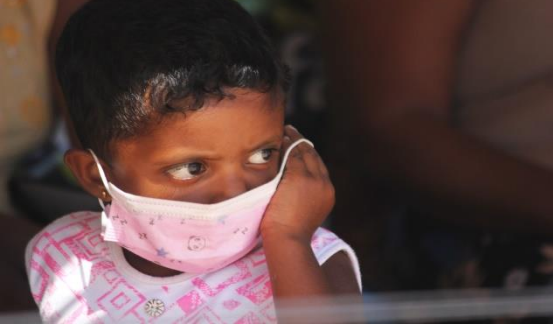
ஹம்பாந்தோட்டை, சூரியவேவையில் முகக்கவம் அணிந்த பிள்ளை