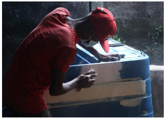
සංවරණ සීමා ඉවත් කරනු ලැබීමෙන් පසුව නැවත වැඩ ආරම්භ කර ඇති යාපනය නල්ලුර් ප්‍රදේශයේ ගරාජයක සේවකයෙක්

අපිට ඒවා නියම විදියට ලැබුණා. පිටස්තර අයත් ගොඩක් ඉන්නවා; අපි ගැන ලොකු හැඟීමක් කියෙන අයත් අපට විශාල සහයෝගයක් දෙනවා.