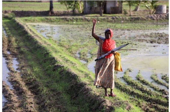
අනුරාධපුර ප්‍රදේශයේ ගෙවිලියක්, 2021

මම ඉපලෝගම ප්‍රදේශයේ ප්‍රජා කටයුතු වලට සම්බන්ධ වෙලා ඉන්නේ. මම මේ ප්‍රදේශයේ තියෙන ප්‍රධාන ම කාන්තා සංගමයේ ලේකම්. මගේ දුව ගිය අවුරුද්දේ විශ්වවිද්‍යාලයට තේරුණා, දැන් අධ්‍යයන වාරේ පටන් අරගෙන තියෙන්නේ.