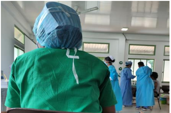
මහනුවර පිහිටි එන්තක්කරණ මධ්‍යස්ථානයක දී සෞඛ්‍ය අංශයේ නිලධාරීන් ගෙන් ලැබෙන සහාය

සෞඛ්‍ය අංශයෙන් අපට අවශ්‍ය වන සහාය, විශේෂයෙන් ම නිවසේ නිරෝධායනය වීමේ දී අවශ්‍ය සහාය උපරිම වුණා. ඒ වගේම එන්නත් ලබා දීමේ