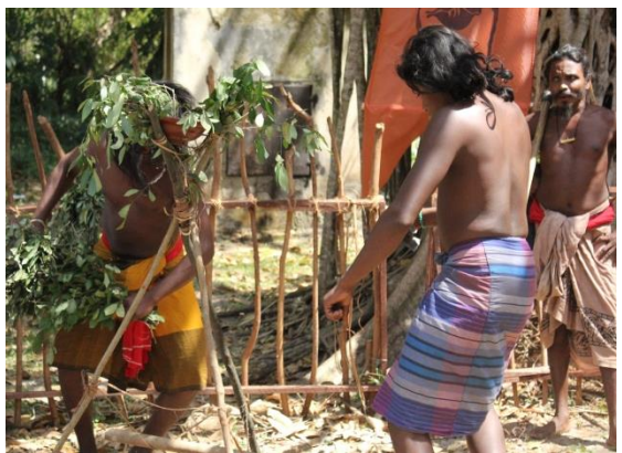
දඹානේ ආදිවාසී ප්‍රජාව

දඹානේ පදිංචි ආදිවාසී ප්‍රජාවට අයත් වයස අවුරුදු 54 ක පිරිමි පුද්ගලයෙකු සමග මෙම සම්මුඛ සාකච්ඡාව පවත්වන ලදී. ඔහු දඹාන ප්‍රදේශයේ රජයේ පාසලක සේවය කරන ගුරුවරයෙක් වේ. එමෙන්ම ඔහු ලේඛකයෙක් ද වේ. ඔහු දඹානේ ආදිවාසී ප්‍රජාව අතරින් විශ්වවිද්‍යාලයකට ඇතුළත් වූ පළමු වැනි සාමාජිකයා වේ.