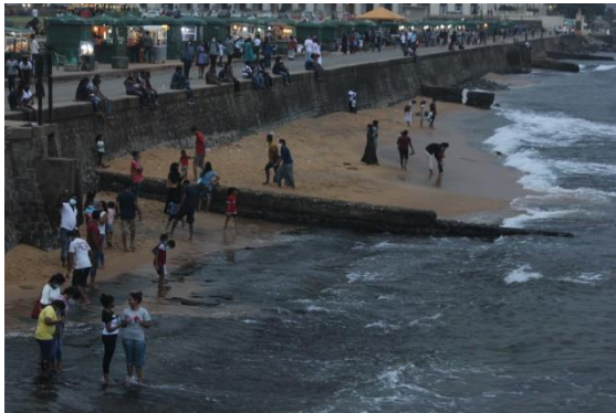
පළමු වැනි අගුළු දැමීම අවසන් වීමෙන් දින කිහිපයකට පසුව 2020 වර්ෂයේ දී ගාලු මුවදොර වෙරළ දිස් වූ අයුරු

2021 වර්ෂය ආරම්භයේ සිටම, අනෙකුත් බොහෝ රටවල් මෙන් ම ශ්‍රී ලංකාව ද එන්නත්කරණ වැඩසටහන දියත් කිරීම කෙරෙහි අවධානය යොමු කිරීමට පටන් ගත්තේය. එන්නත්කරණ වැඩසටහනෙහි පළමු වන අදියරේදී එය මන්දගාමී, දුර්වල ලෙස කළමනාකරණය කරන ලද ක්‍රියාවලියක් බව පැහැදිලිව පෙනෙන්නට තිබූ අතර, අවසානයේ එන්නතේ දෙවැනි මාත්‍රාව සහ වර්ධක (බුස්ටර්) මාත්‍රාව ලබා දීමේදී එය වැඩිදියුණු විය. නිල දත්ත වලට අනුව, 2021 වර්ෂය අවසානය වන විට, ශ්‍රී ලංකාව මිලියන 21 ක් වූ ස්වකීය ජනගහනයෙන් 63% ක් කොරෝනා වෛරසයට එරෙහිව සම්පූර්ණයෙන් ම එන්නත්කරණය කර, තුන් වන මාත්‍රාවක් ලෙස 18.4% ක ප්‍රමාණයකට ගයිසර් එන්නත ලබා දී තිබුණු අතර, දෛනික මරණ සංඛ්‍යාව 20 ක් පමණ විය.