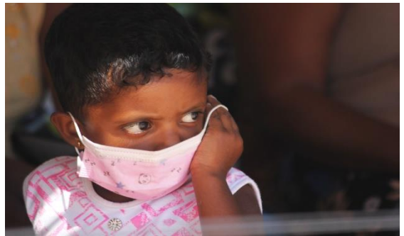
හම්බන්තොට, සුරියවැව ප්‍රදේශයේ කුඩා දරුවෙක් මුඛ ආවරණයක් පැළඳ

බලධාරීන් එන්නත්කරණ වැඩසටහන පවත්වනා කියලා නිවේදනය කළා, ඊට පස්සේ සයිනොෆාර්ම් එන්නත ලබා දුන්නා. ඔවුන් ඒක මුලින් ම ලබා දුන්නේ වයස අවුරුදු 60 සහ එයට වැඩි පුද්ගලයින්ට යි. ඔවුන් විශේෂ ඉල්ලීමක් මත ඒක දෙතියායේ වෘත්තීය සමිති සාමාජිකයින්ට ලබා දුන්නා. මගේ වයස අවුරුදු 24 යි. මමත් වෘත්තීය සමිතිය හරහා එන්නත ලබා දෙන ලෙස ඉල්ලීමක් කළා. මටත් මාත්‍රා දෙක ම විදලා තියෙන්නේ. ප්‍රාදේශීය ලේකම්වරයාත් මේ ක්‍රියාවලියට සහාය දැක්වුවා. විශේෂිත ගැටළු නම් මොනවත් වාර්තා වුණේ නැහැ. සමහර අය එන්නත ලබා ගැනීම ප්‍රතික්ෂේප කළා, ඒත් පස්සේ අපේ ප්‍රජාවේ අනෙක් අය එයාලට මග පෙන්වමින් එයාලව දැනුවත් කළා, ඒ වගේ ක්‍රියාමාර්ග වලින් පස්සේ බොහෝ දෙනෙක් එන්නත ලබා ගත්තා.