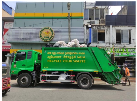
කොළඹ මහ නගර සභාවේ සනීපාරක්ෂක කමිතුවෙන් කොමිටිකරුවන් ප්‍රදේශයේ කසල එකතු කරමින්

මම නිරීක්ෂණය කළ ආකාරයට, හෝමාගම ප්‍රදේශයේ කසල ප්‍රතිචක්‍රීකරණය කිරීමේ ක්‍රියාවලියේ යම් යම් ගැටළු තියෙනවා. පැහැදිලිව ම, මෙම වසංගත තත්ත්වය තුළ කසල ප්‍රතිචක්‍රීකරණය කළමනාකරණය කිරීමේ ප්‍රායෝගික දුෂ්කරතා තියෙනවා. සියලු දෙනා ම නගර සභාවට හෝ පිරිසිදු කිරීමේ හා කසල කළමනාකරණය කිරීමේ නිරත වන පුද්ගලයින්ට දොස් පවරන්නට උත්සාහ කරනවා, මොකද ඒක එයාලගේ කාර්යය සහ වගකීම නිසා. නමුත් ජනතාවටත් තමන්ගේ නිවසේ එකතු වන කසල ටික නිසි පරිදි කළමනාකරණය කර ගන්න වගකීමක් තියෙනවා. මිනිස්සු ඔවුන්ගේ ආකල්ප සහ හැසිරීම් වෙනස් කර ගත්තොත් මේක තවදුරටත් වැඩිදියුණු කර ගත හැකි දෙයක්. පිරිවට්ටු කොවිචර ලස්සනද කියලා හැමෝම කතා කරනවා, ඒත් තනි තනිව තමන්ගේ දායකත්වයෙන් රට පිරිසිදුව තියාගන්න කවුරුත් වැඩ කරන්නේ නැහැ. බොහෝ අය තමන්ගෙ කසල මලු නගරාසන්න ප්‍රදේශවල හුදකලා ප්‍රදේශවලට විසි කරන්න උත්සාහ කරනවා. ලොක්ඩවුන් කරල තියෙන කාලයේදී පවා මේක බොහෝ විට සිද්ධ වෙනවා. කසල කළමනාකරණය ගැන කථා කරන විට, ඒක වඩා හොඳින් පරිපාලනය කරන්න ක්‍රියාමාර්ග ගත යුතුයි. වන විනාශයන් මේ විදියට ම සිද්ධ වෙනවා.