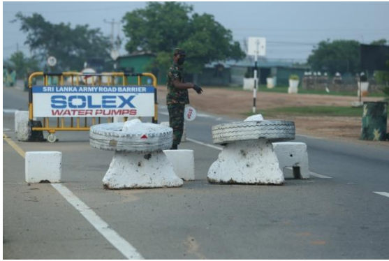
කොවිඩ්-19 නව කොරෝනා වෛරසය පැතිරීම වැළැක්වීමේ ක්‍රියාමාර්ගයක් ලෙස ප්‍රාදේශීය ප්‍රදේශ අතර සංචරණ සීමා පනවා තිබූ අවස්ථාවක යාපනය අලිමංකඩ ප්‍රදේශයේ මුරපොළක ශ්‍රී ලංකා පොලිස් විශේෂ කාර්ය බලකායේ සාමාජිකයින් මුඛආවරණ පැළඳ මුර රාජකාරියේ නිරතව සිටින අයුරු

මගේ ගමේ අභ්‍යන්තර උපකාරක සේවාව හොඳයි. ඒත් එයාලා නිරෝධායනයට ලක්වෙලා ඉන්න පුද්ගලයින් සඳහා ලබා දෙන රුපියල් 10,000 ක අත්‍යාවශ්‍ය සලාකය ලබා දුන්නේ නැහැ. ඒක දෙන්නේ දින 14 ක නිරෝධායනය යටතේ සිටින අයට පමණයි කියලා කිව්වා. අපේ ප්‍රදේශයේ නිරෝධායන කාලය දින 10 ට අඩුයි. මේ ප්‍රදේශයේ ඉන්න සමෘද්ධි ප්‍රතිලාභීන් සංඛ්‍යාව අඩුයි. නමුත් අඩු ආදායම්ලාභී ජනතාව සඳහා සහනාධාරය ලබා දෙනවා. දැන් රුපියල් 2,000 ක සහනාධාරයකුත් දෙන්න පටන් අරන්. ඒ ක්‍රියාවලීන් පිළිබඳව සහ ඒවා හොඳින් කළමනාකරණය කළාද නැද්ද යන්න ගැන මම එතරම් දන්නේ නැහැ. මේ ප්‍රදේශයේ එම ක්‍රියාවලියට සහයෝගය දක්වන්න දේශපාලන නියෝජිතයින් සම්බන්ධ වුනේ නැහැ. ඒත් එක ඇමැතිවරයෙක් කොත්මලේ සහ පුඩුඵ ඔය අවට ප්‍රදේශවල ජනතාවට උදව් කරනවා කියලා මට ආරංචි වුණා.