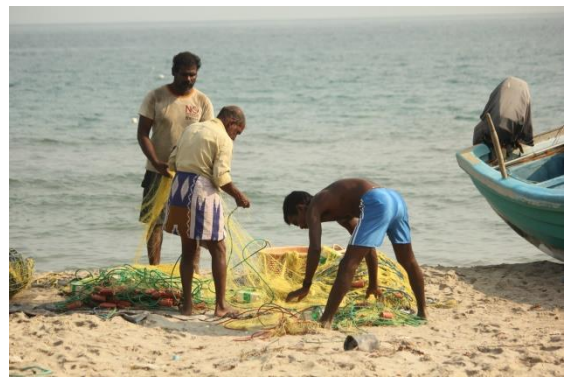
යාපනය කරෙයිනගර් දූපතේ ධීවර ප්‍රජාව

ජීවත්වීම ඉතාමත් දුෂ්කර වෙලා තියෙන්නේ. අපිට රජයෙන් ප්‍රමාණවත් සහයෝගයක් ලැබුණේ නැහැ. අපි ණය අරගෙන තියෙනවා; ඒවයේ පොළී ගොඩක් වැඩි නිසා අපි ඒවා ගෙවන්න වෙරදරමින් ඉන්නේ. මගේ දුවගේ මහත්තයා ලීසිං ක්‍රමයට වාහනයක් ගත්තා; ඒක ආපහු ගෙවන්නත් අපි වෙහෙසෙමින් ඉන්නේ. අපි ඒක ගත්තේ පොඩි ව්‍යාපාරයක් කරන්න, ඒත් ඒක නඩත්තු කරන්න අමාරු නිසා අපි ඒක හමුදාවට කුලියට දුන්නා. මගේ බෑනා ඉදිකිරීම් වැඩ කරමින් සිටියේ, ඒත් වසංගත තත්වය තුළ ඒවා කරගෙන යන්න බැරි වුණා. කොහොම වුණත්, අපේ ගෙවත්ත නිසා අපි ආහාර සුරක්ෂිතතාවය සම්බන්ධයෙන් කිසිම දුෂ්කරතාවකට මුහුණ දුන්නේ නැහැ.