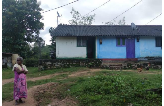
මොණරාගල ප්‍රදේශයේ වත්තක පිහිටි නිවාසය

පරිසර හානිය කියලා දෙයක් මම දැක්කේ නැහැ. සිරිමිඛිඅඩි ප්‍රදේශයේ වැඩිපුර තියෙන්නේ පොල් වතු නිසා මේ පැත්තේ වන විනාශය වගේ දේවල් වෙන්න විදිහක් නැහැ. ඒත් සමහර ප්‍රදේශවල වන අලි ගැටළුව තියෙනවා. ඒ හේතුව නිසා වියළි කාල වලදී වගා හානි බොහෝ සෙයින් ඉහළ ගිහිල්ලා තියෙනවා.