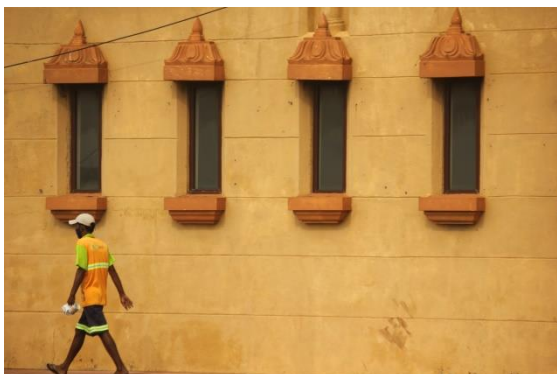
කොළඹ, වැල්ලවත්ත ප්‍රදේශයේ සනීපාරක්ෂක කම්කරුවන්

සාමාන්‍යයෙන් ජනතාව ගෙන් බොහෝ දෙනෙක් සෞඛ්‍ය නියමයන් අනුගමනය කලා, ඒත් අගුළු දැමීම් මිනිසුන්ගේ ජීවනෝපාය සහ ආදායම කෙරෙහි විශාල බලපෑමක් එල්ල කලා. අපිට අපේ අස්වැන්න විකුණා