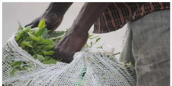
හපුතලේ තේ වත්තක නෙලන ලද තේ දළ රැගෙන යන කම්කරුවෙක්, 2017

මේ ප්‍රදේශයේ මිනිස්සුන් ගෙන් වැඩිදෙනෙක් වැවිලි අංශයේ වැඩ කරන්නේ. ඔවුන් තේ වගාවේ සෑම අංශයකට ම සම්බන්ධ වෙලා ඉන්නවා - වැඩිපුර ම කරන දේවල් තමයි තේ දළ නෙලීම, ප්‍රවාහනය, සහ වතු පරිපාලනය. මිනිසුන් ගෙන් 90% ක් ම තේ වගාවෙන් තමයි තමන්ගේ ජීවිකාව උපයා ගන්නේ. මගේ පවුලේ අම්මයි, තාත්තයි, බාප්පලයි දවස් කුලියට වැඩ කරන අය. අපි ජීවත්වෙන්නේ සහ අවශ්‍යතා කළමනාකරණය කරගන්නේ ඒ ආදායමෙන්. ඒ විදියට බැලුවහම, අපේ දවසේ ආදායම නැතිවෙන හැම දවසක්ම අපේ මුළු පවුලට ම බලපානවා. මගේ ආවිච්චි සියයි ගොඩක් වයසයි, එයාලට බෙහෙත් ඕනෑ. ඒවා කළමනාකරණය කර ගැනීමේ දී අපි දුෂ්කරතාවලට මුහුණ දෙනවා.