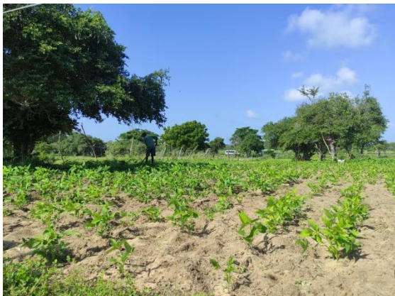
අම්පාර පානම ප්‍රදේශයේ වගා බිම්ක වැඩකරන ගොවියෙක්

ආහාර සුරක්ෂිතතාවය තිබීමේ අවශ්‍යතාවය සහ මිනිසුන්ගේ මුදල් හිඟකම හේතුවෙන් ගෙවතු වගාව වැනි ක්‍රියාකාරකම් දිරිමත් වෙලා තියෙනවා. සෑම කෙනෙක් ම යමක් වගා කිරීමට උත්සාහ කරනවා.