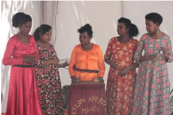
ලංකා අප්‍රිකානු ප්‍රජාවේ සාමාජිකයින් ඔවුන්ගේ ජන සංගීත අංශක් රඟදක්වමින්

පුත්තලම සිරම්බිඅඩි ප්‍රදේශයේ ජීවත් වන ලංකා අප්‍රිකානු ප්‍රජාවට අයත් 55 හැවිරිදි කාන්තාවක සමග මෙම සම්මුඛ සාකච්ඡාව පවත්වන ලදී. ඇය වෘත්තියෙන් ජන සංගීතඥයෙක් වේ.