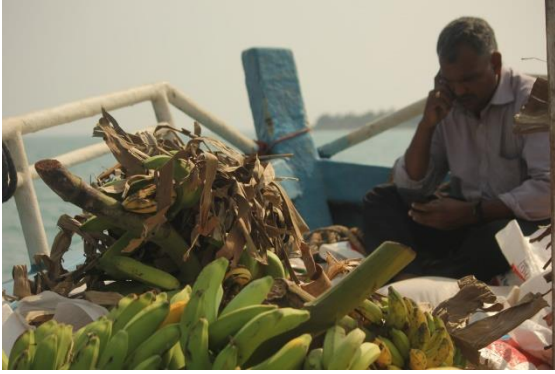
බෙල්ෆ්ට් දූපත, යාපනය