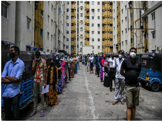
එන්නත ලබා ගැනීම සඳහා කොළඹ සහසුදුර නිවාස සංකීර්ණයේ පෙළ ගැසී සිටි ජනතාව

සිදු වූ මරණ පිළිබඳව සියලු දෙනා ම සෞඛ්‍ය නිලධාරීන්ව දැනුවත් කළා. ඒ වගේම, සමහර ආසාදිතයින්ව හඳුනාගත්තහම, ඔවුන්ගේ පළමුවන සහ දෙවන පෙළ ආශ්‍රිතයින්ව හඳුනා ගැනීමට සහ නිරෝධායන ක්‍රියාවලිය නිසි ලෙස ඇගයීමට ඔවුන්ව භාවිතා කළා. ඔවුන් ගොඩක් පරීක්ෂණක් සිදු කළා. ප්‍රතිඵල දැනුම් දීමට සාමාන්‍යයෙන් දින පහක් පමණ ගත වුණා.