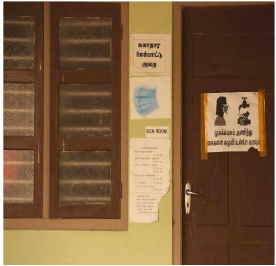
යාපනයේ පාසලක සෞඛ්‍ය උපදෙස් සහිත දැන්වීම් එන්නත්කරණය

සති තුනකට පෙර මගේ සහෝදරියට වෛරසය ආසාදනය වුණ වෙලාවේ ඔවුන් (සෞඛ්‍ය බලධාරීන්) ඇන්ටිජන් පරීක්ෂණය විතරයි කලේ. එහෙම වුනත්, ඔවුන් නිවසෙන් පිටත අනතුරු ඇඟවීමේ නිවේදනයක් ඇලෙව්වෙ වත් නැහැ; ඒවගෙම ඔවුන් අනෙක් සමීපතම පවුලේ සාමාජිකයින්ව පරීක්ෂා කර බැලුවෙත් නැහැ. නිරෝධායනයට ලක්කර සිටි අයට රජය සලාක මල්ලක් ලබා දුන්නා. ඒත් අපේ පවුලට ඒක ලැබුණේ නැහැ. මෙම කාලය තුළ අපේ අසල්වැසියන් අපිට අත්‍යවශ්‍ය ද්‍රව්‍ය ගෙනත් දෙමින් උපකාර කලා, ඒත් අපේ අනිවාර්ය නිරෝධායන කාලය අවසන් වුණාට පස්සෙ, ඔවුන් අපට අවශ්‍ය දේවල් සඳහා වියදම් කළ මුදල ආපසු ගෙවන්න අපිට සිද්ධ වුණා.