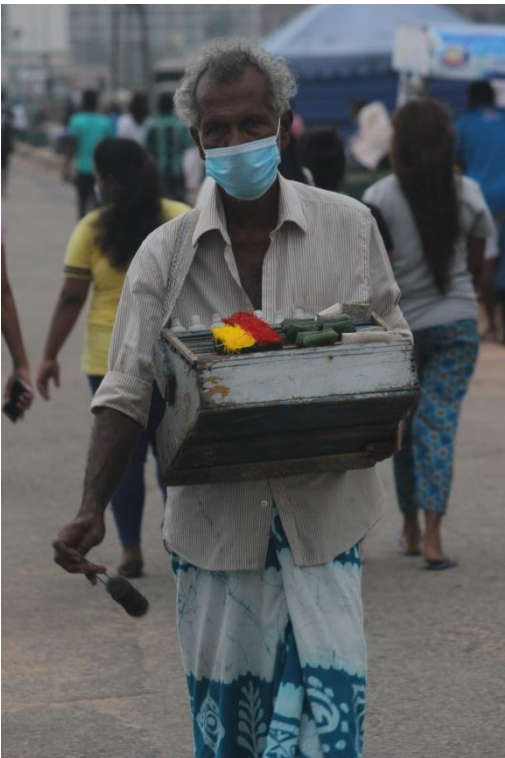
හාලුමුවදොර පිරිසේ සාරවිට වෙළෙන්දෙක්

නමුත් තවත් පැති වලින් බැලුව ම, බොහෝ දේවල් කලකිරීම ඇතිකරවනවා. ඇතැම් අවස්ථා වලදී රජය තමන්ගෙ වැරදි වසන් කර ගන්න මේක අවස්ථාවක් කර ගන්නවා. උදාහරණයක් විදියට පාස්කු ඉරිදා සිද්ධිය සම්බන්ධ ගැටළු සහ තවත් බොහෝ දේවල් තියෙනවා. බොහෝ තරුණයින් රට හැර යන්න උත්සාහ කරනවා, ඒත් ඒක රටේ අනාගතයට හොඳ නැහැ. බුද්ධිගලනය අපේ රටට විශාල ප්‍රශ්නයක් වෙලා. යහපත් අනාගතයක් සඳහා අපි සියලු දෙනා සාමූහිකව කටයුතු කළ යුතුයි.