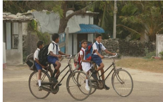
සිසුන් පාපැදි වලින් පාසලට යමින්, යාපනය දිස්ත්‍රික්කය, ශ්‍රී ලංකාව

මේ වසංගතයේ අවදානමෙන් මිදෙන්න තියෙන එකම මාර්ගය ලෙස රජය එන්නත්කරණ ක්‍රියාවලියට ප්‍රමුඛත්වය දීලා තියෙනවා. ඒත් දැන් අගුලු දැමීම තත්වය පාලනය කරන්න තියෙන ඵලදායී ක්‍රමයක් නෙමෙයි. මීට පෙර එන්නත් කිරීමේ ක්‍රියාවලියට බොහෝ දුෂ්කරතා ඇති වුණා. නමුත් දැන් ඒක වඩාත් හොඳ ආකාරයෙන් ක්‍රියාත්මක වෙමින් පවතිනවා.