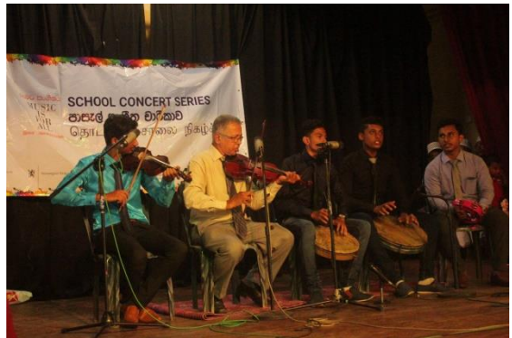
සංස්කෘතික ප්‍රසංගයක් අතරතුර පෘතුගීසි බර්ගර් ප්‍රජාවේ සාමාජිකයින්

නැගෙනහිර පළාතේ තෘතීයික අධ්‍යාපන ආයතනයක කළමනාකරණ සහකාරවරයෙක් ලෙස සේවය කරන, පෘතුගීසි බර්ගර් ප්‍රජාවට අයත් 38 හැවිරිදි තරුණයෙකු සමඟ මෙම සම්මුඛ සාකච්ඡාව සිදු කරන ලදී. පසුගිය වසර කිහිපය පුරා ඔහු ශ්‍රී ලංකාවේ පෘතුගීසි බර්ගර් ප්‍රජාව අතර සුළුතර අයිතිවාසිකම් ක්‍රියාකාරීත්වයට සහ සංස්කෘතික සංගම්වලට සම්බන්ධව සිටී අයෙකි.