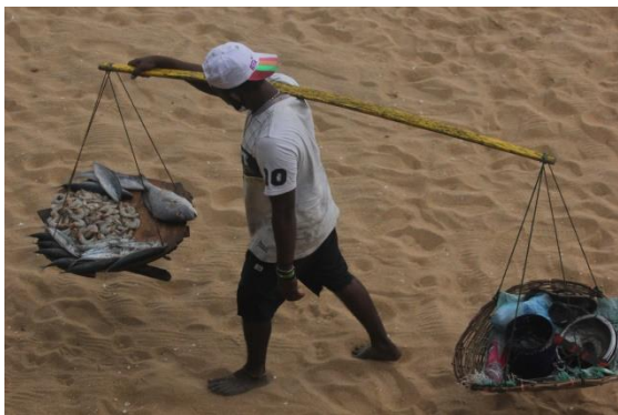
දෙහිවල මුහුදු වෙරළේ මාළු වෙළෙන්දෙක්

කෝවිඩ්-19 වසංගතයේ තුන්වන රැල්ලෙහි සීඝ්‍ර වර්ධනයෙන් පසුව සහ සංවරණ සීමා සහ අගුළු දැමීම් තවදුරටත් අඛණ්ඩව පැවති කාලය වූ 2021 මැයි මාසයේ සිට ඔක්තෝබර් මාසය දක්වා වූ කාලය තුළ මෙම සම්මුඛ සාකච්ඡා සිදු කරන ලදී. සංවරණය සීමා කර තිබූ නිසාත්, සම්මුඛ සාකච්ඡාවලට භාජනයවූවන් පෞද්ගලිකව හමුවීමට හැකියාවක් නොතිබූ නිසාත් දුරකථන ඇමතුම් හරහා සම්මුඛ සාකච්ඡා සිදු කරන ලදී.