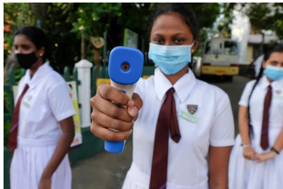
ස්පර්ශ නොවන අධෝරක්ත ශරීර උෂ්ණත්වමානයක් දිගුකර සිටින පාසල් ශිෂ්‍යාවක්

මහජන සෞඛ්‍ය පරීක්ෂකවරු (PHI) සහ සෞඛ්‍ය අමාත්‍යාංශය (MOH) අනුගමනය කරන ප්‍රවේශයන් කාලයත් සමග වෙනස් වෙලා තියෙන්නේ. වසංගතයේ මුල් කාලයේදී ඔවුන් මෙම ක්‍රියාවලිය සඳහා කැපවී සිටියා. දැන් ආසාදිතයින්ගේ සංඛ්‍යාව ඉහළ යමින් තියෙන්නේ; ආහාරපාන සහ අනෙකුත් පහසුකම් ඇතුළු නිරෝධායන පහසුකම් ද යහපත් තත්වය නැහැ. කොහොම වුණත්, ඔවුන් එන්නත් කිරීමේ ක්‍රියාවලිය පරිපාලනය කළ ආකාරය ගැන නම් මම ඉතාමත් සතුටු වෙනවා. බොහෝ ගම්මානවල, වයස අවුරුදු 30 සහ එයට වැඩි පුද්ගලයින් ගෙන් 90% ක් විතර සම්පූර්ණයෙන් ම එන්නත් කරල තියෙන්නේ.