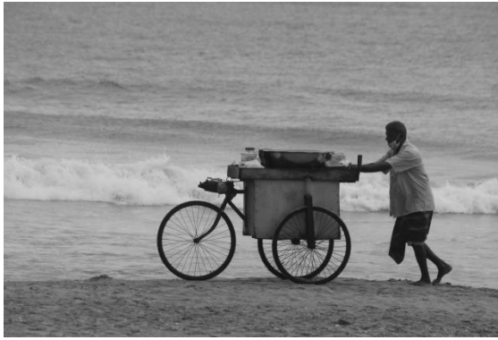
ගල්කිස්ස ප්‍රදේශයේ විදිවල ආහාර අලෙවිකරන ජංගම වෙළෙන්දෙක්

කොවිඩ්-19 වසංගතය වෛද්‍යමය හදිසි තත්වයකට මෙන්ම සැලකිය යුතු ආර්ථික අවහිරතාවයකට ද හේතු වී ඇති නමුත්, ශ්‍රී ලංකාවේ දැනට පවතින ආර්ථික අර්බුදය වසංගතයට වඩා බෙහෙවින් පුළුල් සහ වඩා දීර්ඝ කාලීන ක්‍රියාවලියක් තුළින් බිහි වූවක් වන අතර, එය සමාජයේ ඇතැම් ස්ථරවලට සෘජු හා වක්‍ර බලපෑම් එල්ල කර තිබේ.