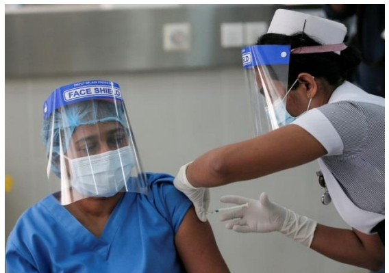
සෞඛ්‍ය අංශයේ නිලධාරියෙක් කොවිඩ්-19 ඇස්ට්‍රා සෙනිකා එන්නත් මාත්‍රාවක් ලබා ගනිමින්, 2021 ජනවාරි, කොළඹ, මූලාශ්‍රය: රොයිටර්, ඡායාරූපය: දිනුක ලියනවත්ත

එන්නත්කරණ ක්‍රියාවලිය හොඳින් පරිපාලනය කලා. අපිට ගිය සතියේ පළමු වන මාත්‍රාව ලැබුණා; දෙවන මාත්‍රාව ගන්න තියෙන්නේ ඊළඟ මාසේ. ගමේ ඉන්න අවුරුදු 60 ට වැඩි වැඩිහිටි අයට මාත්‍රා දෙකම දීලා තියෙන්නේ. එන්නත් කිරීම ගැන මුලදී ජනතාව තුළ යම් අකමැත්තක් තිබුණත් පසුව දැනුවත් කිරීමේ වැඩසටහන් කිහිපයක් පැවැත්වූවා. එන්නත ලබා දීමේ ක්‍රියාවලිය හොඳින් සිදු වුණා. ග්‍රාම නිලධාරී වසම් 3 ක ජනතාව එක මධ්‍යස්ථානයක දී එන්නත් කලා. මෙම මධ්‍යස්ථාන තුළදී ත් සමාජ දුරස්ථාවය සහ සෞඛ්‍ය