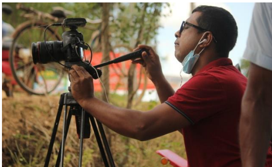
වසංගත කාලය තුළ ජනමාධ්‍ය

ආසාදනය වෙච්ච අය ගැන, ඒ අයගෙන් ආසාදනය බෝවුණු අය ගැන, ආසාදනය වෙච්ච නැති අය ගැන බොරු ප්‍රවෘත්ති විශාල ප්‍රමාණයක් පැතිරීලා තිබුණා. ඒවා කටකතා.