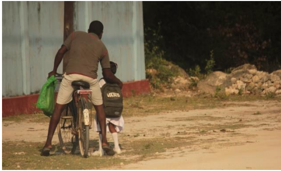
යාපනය බේල්ලේ දූපතේ පියෙක් තම දියණියව ප්‍රාථමික පාසලට රැගෙන ගොස්