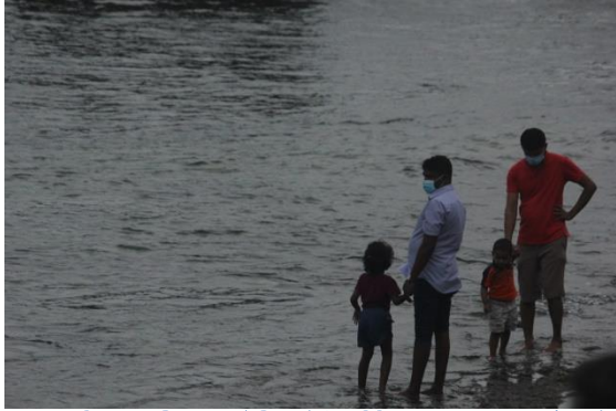
පළමු වැනි අගුළු දැමීම අවසන් වීමෙන් දින කිහිපයකට පසුව 2020 වර්ෂයේ දී ගාලු මුවදොර වෙරළ දිස් වූ අයුරු

ආසාදිතයින් අනුපාතය සීඝ්‍රයෙන් ඉහළ යමින් පවතින තත්වයක් තුළ සෞඛ්‍ය පද්ධතිය කඩාවැටෙමින් පවතින බව රාජ්‍ය නිලධාරීන්, මාධ්‍ය වාර්තා සහ බිම් මට්ටමේ වාර්තා පෙන්වා දුන්නේය. මෙම තත්වය මෙන්ම අරමුදල් සැපයීම ප්‍රමාණවත් නොවීම සහ අකාර්යක්ෂම කළමනාකරණය හේතුවෙන් ඇති වූ තවත් ගැටළු රැසක් නිසා සෞඛ්‍ය ක්ෂේත්‍රය සහ සෞඛ්‍ය සේවකයින් දැඩි පීඩනයකට ලක් වූහ.