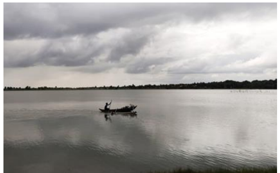
මඩකලපුව, උත්තිවෙයි ප්‍රදේශයේ ධීවර බෝට්ටුවක්

විධිමත් අංශයේ රැකියා කරන අයට මාසික ආදායමක් ලැබෙන බැවින් ඔවුන්ට අත්‍යවශ්‍ය අවශ්‍යතා ඉටුකර ගත හැකියි. ධීවර කර්මාන්තය හා කෘෂිකර්මාන්තය වැනි අවිධිමත් අංශවල රැකියා කරන අය මේ ලොක්ඩවුන් එක සහ අවකාශය නොමැතිකම නිසා තම අස්වැන්න විකුණා ගැනීමට නොහැකිව අපහසුතාවලට මුහුණ දීලා ඉන්නවා. ඔවුන් ආයෝජනය කරන මුදලත් සමග ඔවුන්ට එය විශාල පාඩුවක්.