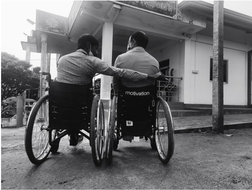
උතුරු පළාතේ උයිරිලෙයි ප්‍රදේශයේ පිහිටුවා ඇති සුසුම්නාව කුවාලවුවන්ගේ සංගමයේ සාමාජිකයින් වසංගතය මගින් තම සාමාජිකයින්ට ඇතිවී තිබෙන බලපෑම පිළිබඳ සාකච්ඡා කරන රැස්වීමක දී