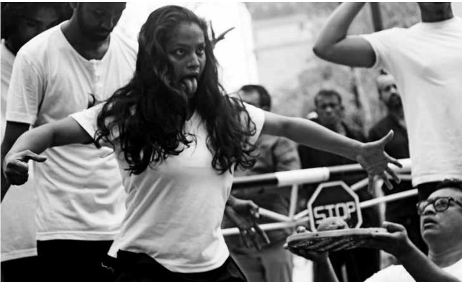
புகைப்படம் 19: மக்கள் எதிர்கொள்ளும் பொருளாதார அழுத்தத்தை எடுத்துக்காட்டுவதற்கு கலைஞர்கள் ஒரு தெரு நாடகத்தை நடத்துகின்றனர்.