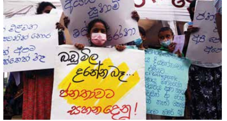
புகைப்படம் 09: காலி, கோட்டாகோகமவில் போராட்டம் (கமகே, GGG காலி 2022).

புகைப்படம் 08: மக்கள் போராட்டத்தின் முதல் நாள். எஸ்.டபிள்யூ.ஆர்.டி. பண்டாரநாயக்காவின் சிலையைச் சுற்றி மக்கள் ஒன்றுதிரள்கின்றனர். (கமகே, காலிமுகத்திடல் ஆக்கிரமிப்பு இயக்கம் 2022)