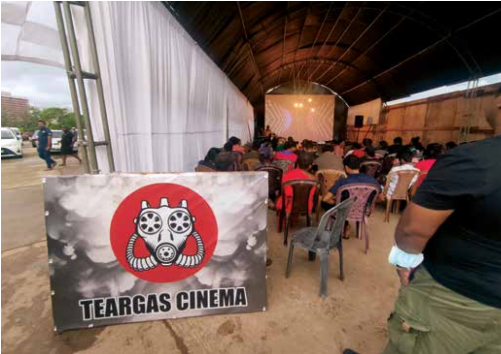
புகைப்படம் 25: ஆரம்ப நாள் - கோட்டாகோகம கண்ணீர்ப் புகைச் சினிமாத் திரையரங்கில் திரைப்படக் காட்சி . (கமகே, கண்ணீர்ப்புகை சினிமா 2022).

உலகளவிலான சமூக, அரசியல் இயக்கங்கள் தொடர்பான திரைப்படமொன்று திரையிடப்பட்டது. இது காலிமுகத்திடல் சுயாதீன திரைப்பட விழாவில் மக்கள் மத்தியில் உள்நாட்டுப் போராட்ட இயக்கத்தின் ஆக்கத்திறனை விரிவுபடுத்த உதவியது.