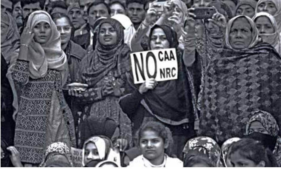
புகைப்படம் 14: இந்தியாவின் குடியரிமைத் திருத்தச் சட்டம், பிரஜைகளின் தேசியப் பதிவேடு மற்றும் தேசியக் குடிமதிப்புப் பதிவேடு ஆகியவற்றிற்கெதிராக இந்தியாவின் புதுடெல்லி ஜமியா மில்லியா இஸ்லாமியா பல்கலைக்கழகத்தில் போராடும் பெண்கள். (கமகே, இந்தியாவின் புதுடெல்லியில் CCA இற்கெதிரான போராட்டக்காரர்கள் 2019)