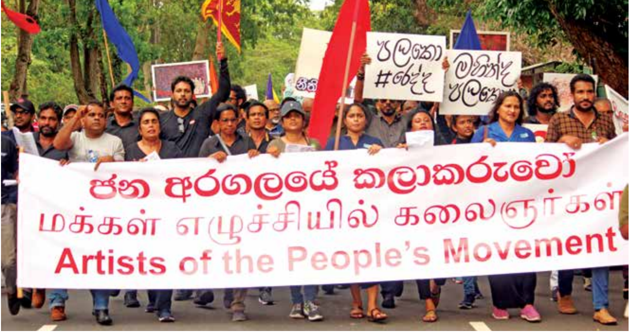
புகைப்படம் 17: மக்கள் எழுச்சியில் கலைஞர்கள் இயக்கத்தின் ஆர்ப்பாட்டப் பவனி, ஏப்ரல் 2022 (கமகே, ஜன அரகலயே கலாகருவோ 2022)

இயக்கத்தின் ஆரம்பத்திலிருந்தே, “ஜன அரகலயே கலாகருவோ” (மக்கள் எழுச்சியில் கலைஞர்கள்) என்னும் முன்னெடுப்பின் மூலம், மக்களின் விரக்தியை வெளிப்படுத்துவதிலும், பல்வேறு விடயங்களுக்காக மக்களை அணிதிரட்டுவதிலும் கலைஞர்களின் குழுக்கள் முக்கியமான பங்கு வகித்தன.