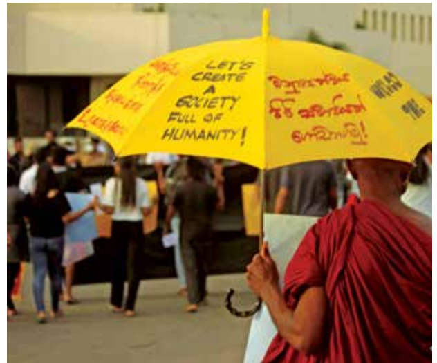
புகைப்படம் 12: செய்தியொன்றை வெளிப்படுத்துவதற்காகத் தனது குடையைப் பயன்படுத்தும் பௌத்த பிக்கு (கமகே, போராட்டக்காரரான துறவி 2022)