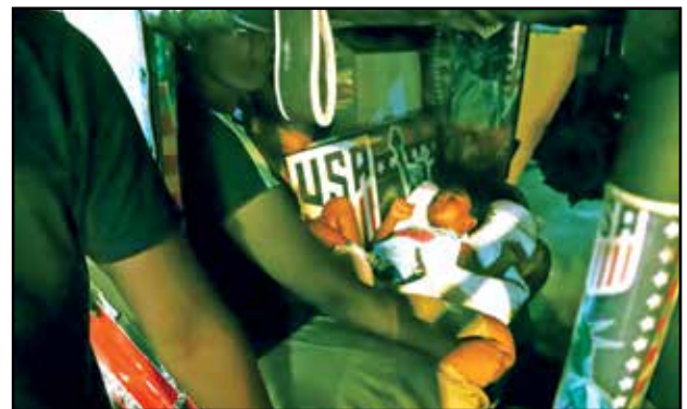
புகைப்படம் 06: விரக்தியான காலம், விரக்தியான வாழ்க்கை. முச்சக்கரவண்டிச் சாரதி, அவரின் மனைவி மற்றும் இரண்டு வயது மகன் ஆகியோர் இரவு முழுவதும் பெற்றோல் வரிசையில் நிறுத்தப்பட்டிருக்கும் முச்சக்கர வண்டியில் தூங்க முயற்சிக்கின்றனர். (கமகே, களனியில் பெற்றோல் வரிசை 2022).