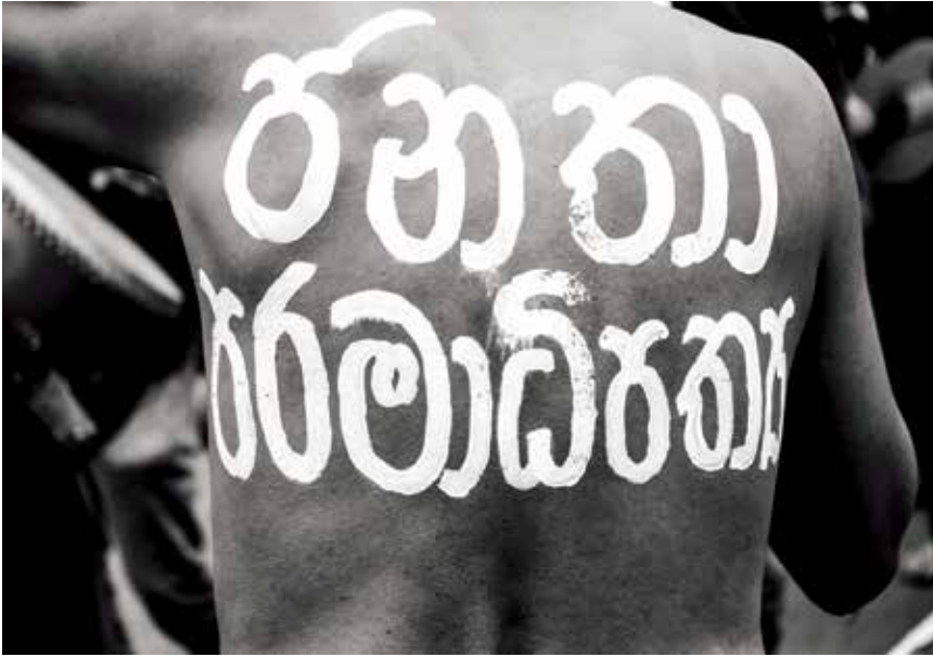
புகைப்படம் 15: தனது உடலில் வரையப்பட்ட “ஐனதா பரமதிபத்ய” (மக்களின் இறைமை) என்னும் வாசகத்துடன் நடிகர் ஜெஹான் அப்துஹாமி. மக்கள் போராட்டத்தின் முதல் நாளில் எடுக்கப்பட்ட புகைப்படம். (கமகே, மக்களின் இறைமை 2022)

இலங்கையின் அரசியல் வரலாறு முழுவதிலும், எதிர்ப்பை வெளிப்படுத்துவதற்கும் வலுப்படுத்துவதற்குமான வழிமுறையொன்றாகக் கலை பயன்படுத்தப்பட்டுள்ளது. 1971 ஆம் ஆண்டின்