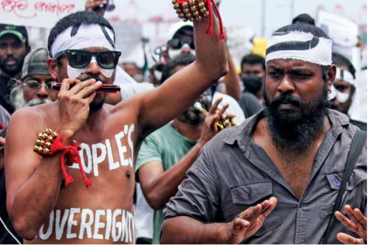
புகைப்படம் 21: காலிமுகத்திடலில் ஆர்ப்பாட்டப் பவனியின்போது “பேக்கரியே கட்டிய” இசைக்குழு (கமகே, பேக்கரியே கட்டிய 2022)

2022 ஆம் ஆண்டு ஏப்ரல் 9 ஆம் திகதி தொடக்கம் பிரபல கலைஞர்களான ஜெஹான் அப்புஹாமி, அஜித் குமாரசிறி மற்றும் விராஜ் லியனாரச்சி ஆகியோரை உள்ளடக்கி “பேக்கரியே கட்டிய” 2 என்னும் இசை மற்றும் நாடகக் குழு, பாடல்களாலும் இசையாலும் நாடகங்களாலும் எதிர்ப்பை ஆக்கப்பூர்வமாக விரிவுபடுத்திப் போராட்ட இயக்கத்திற்குக் குறிப்பிடத்தக்க பங்களிப்பை வழங்கியது. மேலும், “மக்கள் இறைமை” போன்ற வாசகங்களைப் பிரபலப்படுத்துவதற்கு முகச் சித்திரங்கள் உள்ளிட்ட உடற் சித்திரக் கலைகளை அவர்கள் பயன்படுத்தினர். காலிமுகத்திடல் கோட்டாகோகமவில் மட்டுமன்றி கண்டி, குருநாகல் அனுராதபுரம் மற்றும் பல அமைவிடங்களிலும் ‘பேக்கரியே கட்டிய’ குழு பங்குபற்றித் தனது பங்களிப்பை வழங்கியது. அத்துடன், LGBTQ உரிமைப் போராட்டம், சிறையில் அடைக்கப்பட்டுள்ள போராட்டக்காரர்களுக்குப்