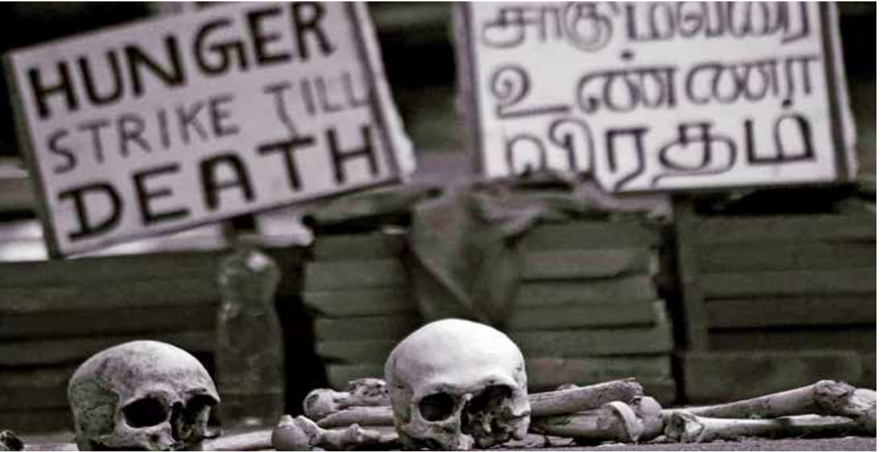
புகைப்படம் 13: ஜந்தர் மந்தர், இந்தியா. அரசாங்கத்தின் கொள்கைகளினாலும் காலநிலையினாலும் ஏற்பட்ட நிதி இழப்புக்களைத் தாங்க முடியாது தற்கொலை செய்துகொண்ட விவசாயிகளின் மண்டையோடுகளைப் பயன்படுத்தி விவசாயிகள் போராட்டத்தில் ஈடுபடுகின்றனர். (கமகே, விவசாயிகள் போராட்டம் 2017)

யூகோஸ்லாவியப் போர்களின் போதும் எகிப்திலும் மத்திய கிழக்கில் உள்ள ஏனைய நாடுகளிலும் ஏற்பட்ட அரபு வசந்தத்தின் போதும் எதிர்ப்பை வெளிப்படுத்துவதற்கு போராட்டக் கலை உருவானது. மிக அண்மையில், இலங்கைக்கு அருகில், இந்தியாவில் குடியரிமைச் சட்டத் திருத்தத்திற்கு எதிரான போராட்டங்களும், விவசாயிகள் போராட்டமும், போராட்டங்களுக்கு உத்வேகமளித்தன. 22 வயதான ஈரானிய மாணவி மஹ்சா அமினி, மிகவும் தளர்வாக முக்காடு அணிந்ததாகக் கைது செய்யப்பட்டதன் பின்னர் பொலிஸ் கட்டுக்காவலில் இறந்தமையானது 2022