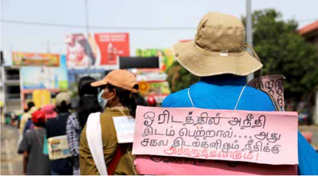
புகைப்படம் 18: நீதிக்கான நடைபவனி 2022, மட்டக்களப்பு (கமகே, நீதிக்கான நடைபவனி 2022)

அரசியல் வெளிப்பாடு மற்றும் கல்விக்கான வெளியொன்றையும் வழங்கியது. பதாகைகளில் உள்ள வாசகங்கள் வெவ்வேறு வெளிப்பாடுகளைக் கொண்டுள்ளன. அவை வெவ்வேறு குறியீடுகளைப் பயன்படுத்துவதுடன் மக்களின் இறுதி இலக்கான - #கோட்டா கோ ஹோம் என ஜனாதிபதி பதவிவிலகுவதை உறுதிப்படுத்துதலை - வலியுறுத்தி வெவ்வேறு கோரிக்கைகளை முன்வைக்கின்றன.