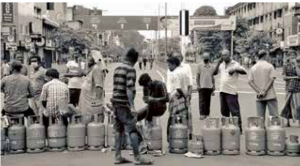
புகைப்படம் 03: எரிவாயு சிலிண்டர் போராட்டம். கொழும்பு 11, ஆமர் வீதி சந்தியில் திரவ எரிவாயு கிடைக்காமையினால் விரக்தியடைந்த போராட்டக்காரர்கள், வீதியை முடினர். (கமகே, சிலிண்டர் போராட்டம் 2022)