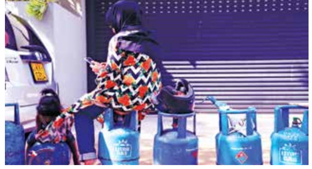
புகைப்படம் 04: பொறுமை மிக்க குடியிருப்பாளர்கள் - கிருலப்பனை சந்தியில் திரவப் பெற்றோலிய வாயுவைக் (LPG) கொள்வனவு செய்வதற்காக வரிசையில் பொறுமையாகக் காத்திருக்கும் ஒரு சிறுமியும் அவரின் தாயும். ஏனைய அத்தியாவசியப் பொருட்களுடன் எரிவாயு சிலிண்டர்களுக்கும் தட்டுப்பாடு நிலவுகின்றது. இலங்கையின் தலைநகர் கொழும்பு. (கமகே, நெருக்கடியை சமாளிக்கும் சிறுமியும் தாயும் 2022)