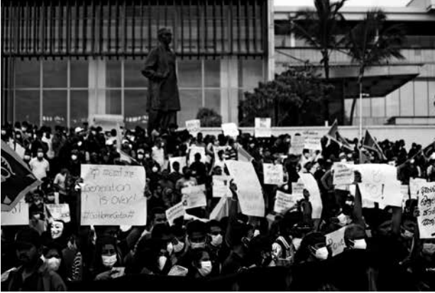
புகைப்படம் 2: காலிமுகத்திடல் முற்றுகைப் போராட்ட இயக்கம். மக்கள் போராட்டத்தின் முதலாம் நாள். (கமகே, காலிமுகத்திடல் ஆக்கிரமிப்பு இயக்கம் 2022)

இலங்கையில் மக்களின் போராட்டம், உள்நாட்டில் அரசகலய (சிங்களத்தில்) மற்றும் போராட்டம் (தமிழில்) என அழைக்கப்பட்ட ஒரு வெகுஜன எதிர்ப்பு இயக்கத்தின் மூலம் வெளிப்பட்டது. நாட்டில் முன்னெப்போதும் ஏற்பட்டிராத பொருளாதாரச் சீர்குலைவு மற்றும் அரசியல் குழப்பத்திற்கான எதிர்வினையே இதுவாகும். நாட்டின் பல்வேறு இடங்களில் முளைத்த சிறு சிறு போராட்டங்கள், மக்கள் இயக்கங்கள் என்பவற்றுடன் ஆங்காங்கே நடைபெற்ற தனித்தனியான போராட்டங்களுடன் வலுவடைந்து ஒரு முழுமையான மக்கள் எதிர்ப்பு இயக்கமாக ஒன்றிணைந்தன. நாடு முழுவதும் இடம்பெற்ற இந்த வெகுஜனப் போராட்டங்கள் மற்றும் ஆர்ப்பாட்டங்களின் அலைகளுடன், புலம்பெயர்ந்தவர்களும் இணைந்தமையினால் நாட்டிற்கு வெளியே இடம்பெற்ற போராட்டங்களும் சேர்ந்து கொண்டன. இதனால் போராட்டங்கள் பிரபலமடைய ஆரம்பித்தன. நெருக்கடிக்கான காரணங்கள் ஆழமாக வேருன்றியிருந்த போதும் கொவிட் 19 பெருந் தொற்றினால் ஏற்பட்ட பொருளாதார அழுத்தங்களுடன், 2020 ஆம் ஆண்டில் இந்நெருக்கடி உச்சத்தை எட்டியது.