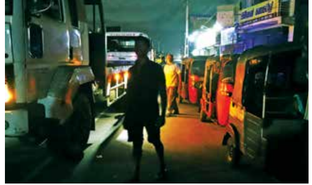
புகைப்படம் 05: இலங்கையின் பொருளாதாரம் மோசமடைந்து வரும் நிலையில் எரிபொருளை வாங்குவதற்கு ஓட்டுநர்கள் இரவு முழுவதும் வரிசையில் காத்திருக்கின்றனர் (கமகே, களனியவில் பெற்றோல் வரிசை 2022).