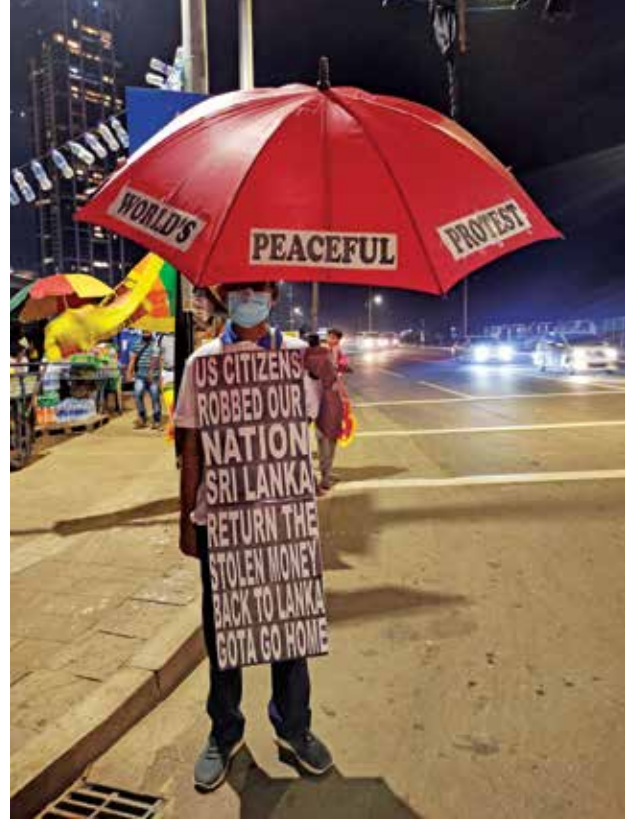
புகைப்படம் 11: ஆக்கபூர்வமான போராட்டக்காரர் (கமகே, ஆக்கபூர்வமான போராட்டக்காரர் 2022)

பிரதானமானதாகும். பெரிய சமூகத்தினரிடையே அரசியலில் எதிர்கொள்ளும் உண்மையான யதார்த்தங்களை விரிவுபடுத்துவதற்கும் ஒடுக்கப்பட்டோருக்கு இது பிரதானமாகின்றது.